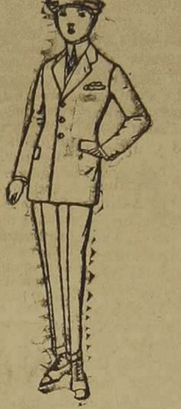
Trajes modelo "Sport", de lanilla, melton, etc., para jóvenes de 10 a 16 años. De ptas. 35 a 85.