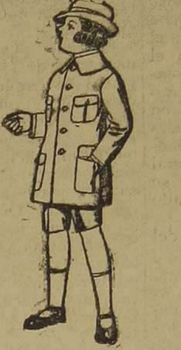
Trajes modelo "Sport", de lanilla, estambre, melton, etc., para niños de 7 a 12 años. De ptas. 28 a 50.