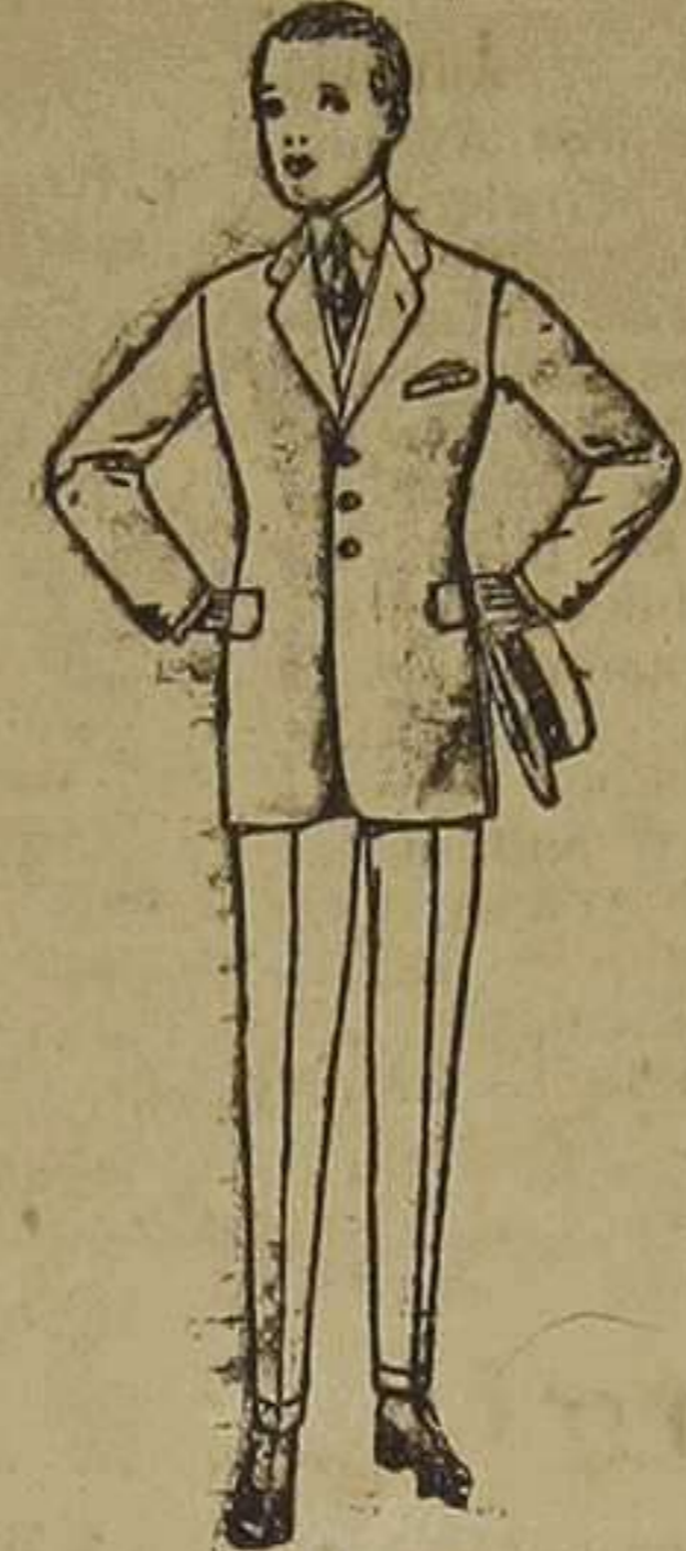
Trajes de lanilla, melton, vicuña, etc., para jóvenes de 10 a 16 años. De ptas. 30 a 80.