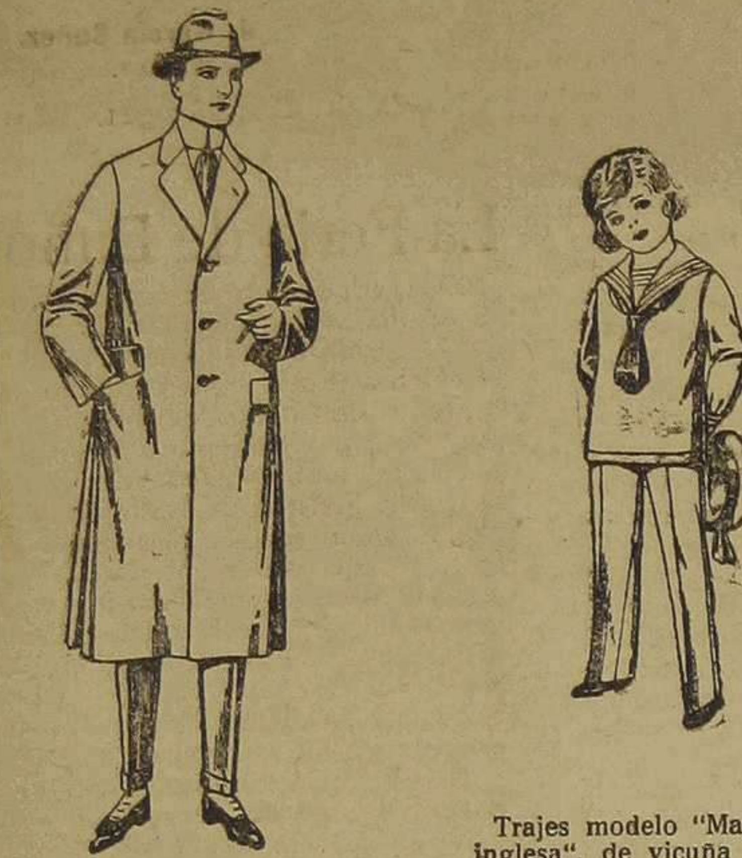
Gabanes de gamuza, melton, etc. De ptas. 48 a 185.