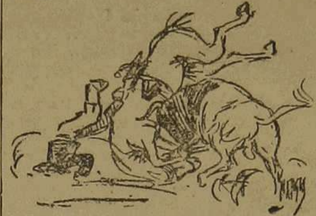
El toro segundo

Con buen estilo, arreó media la gartijera, que fué bastante, y escuchando palmas generales dió vuelta al anillo y salió a los medios.