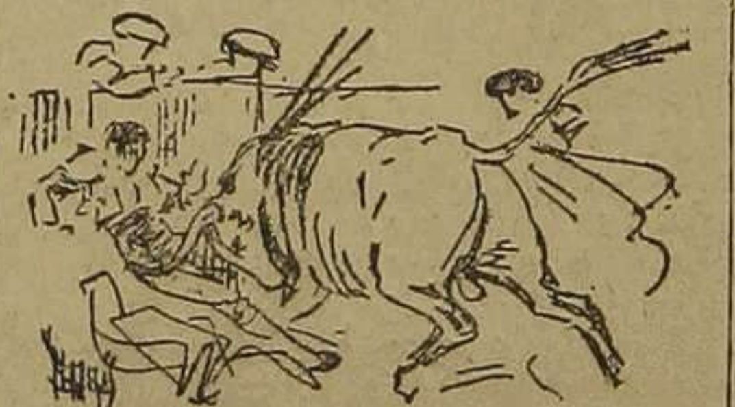
Cogida de Granero en su primero

Después de brindar la muerte de su segundo a una señorita que ocupaba un palco, trasteó por alto y bajo, cerca, intercalando en su labor un natural bueno; pero el toro achuchaba, y fué preciso acabar pronto. Con media algo pasada y tendenciosa, entrando y saliendo bien, y un descabello, acabó, y hubo las palmas y la salida a los medios consiguientes.