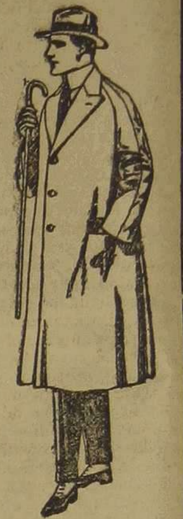
Gabanes de melton, gubardina, etc. De ptas. 70 a 190

Ro. as confeccionadas para caballero, señora, niño y niña