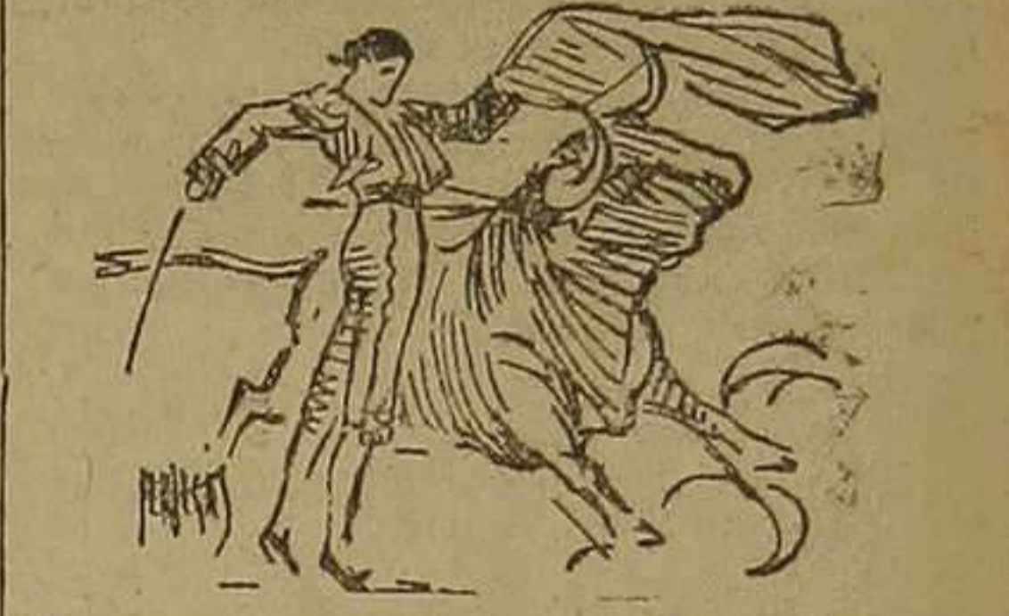
Un pase de Granero en el último toro

Hubo nueva concesión de oreja y dos vueltas por el anillo a hombros de la plebe, mientras en los tendidos se le tributaba ovación clamorosa.