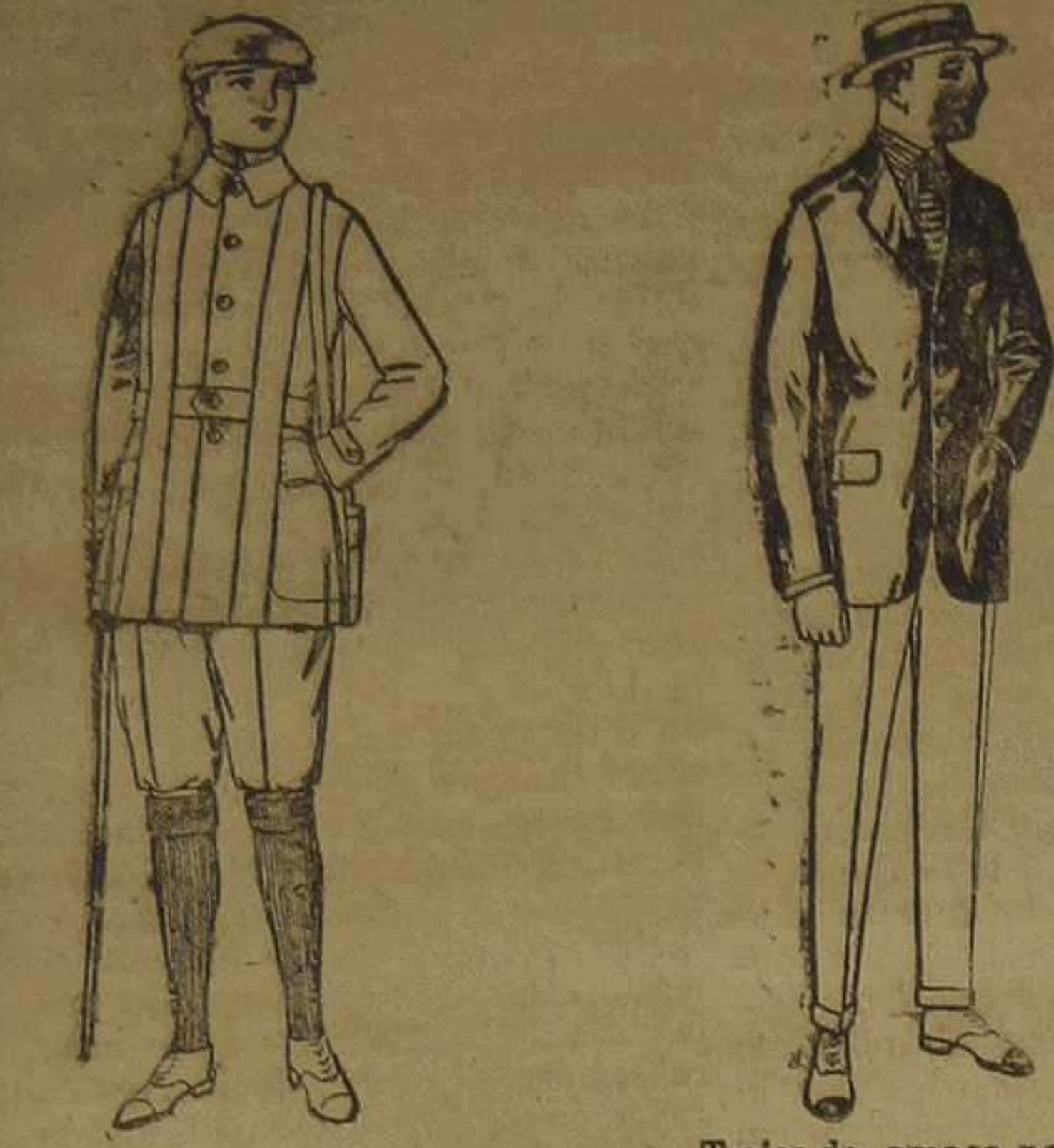
Cazadoras de dril crudo kaki. De ptas. 18 a 30. Pantalones cortos de dril beige o gris, para excursionistas. De ptas. 8 a 18.

SUCURSALES: Madrid, Barcelona, Alicante, Almería, Bilbao, Cádiz, Cartagena, Gijón, Granada, Málaga, Palma de Mallorca, Santander, Sevilla, Valladolid y Zaragoza.