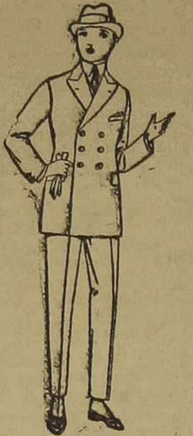
Trajes de lanilla, vicuña o estambre, para jóvenes de 10 a 16 años. De ptas. 33 a 85.