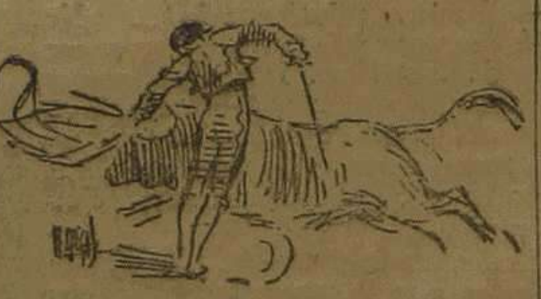
Granero galeando a su último

Con media bien puesta, saliendo por la cara, finiquitó, y cortó su primera oreja, escuchando después ovación clamorosa, cuando daba la vuelta al anillo y cuando salió a los medios.