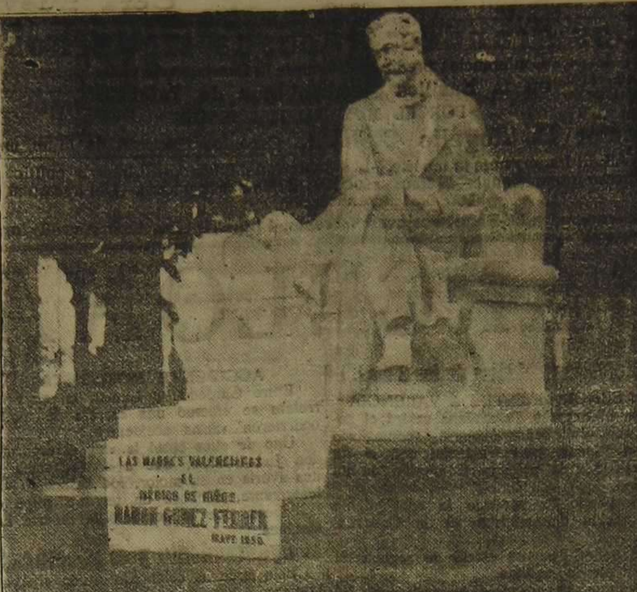
Monumento al Dr. Gómez Ferrer, obra del escultor Sr. Paredes.

Con gran solemnidad y entusiasmo se verificó el domingo por la mañana, en la Gloria, el homenaje al ilustre doctor Gómez Ferrer.