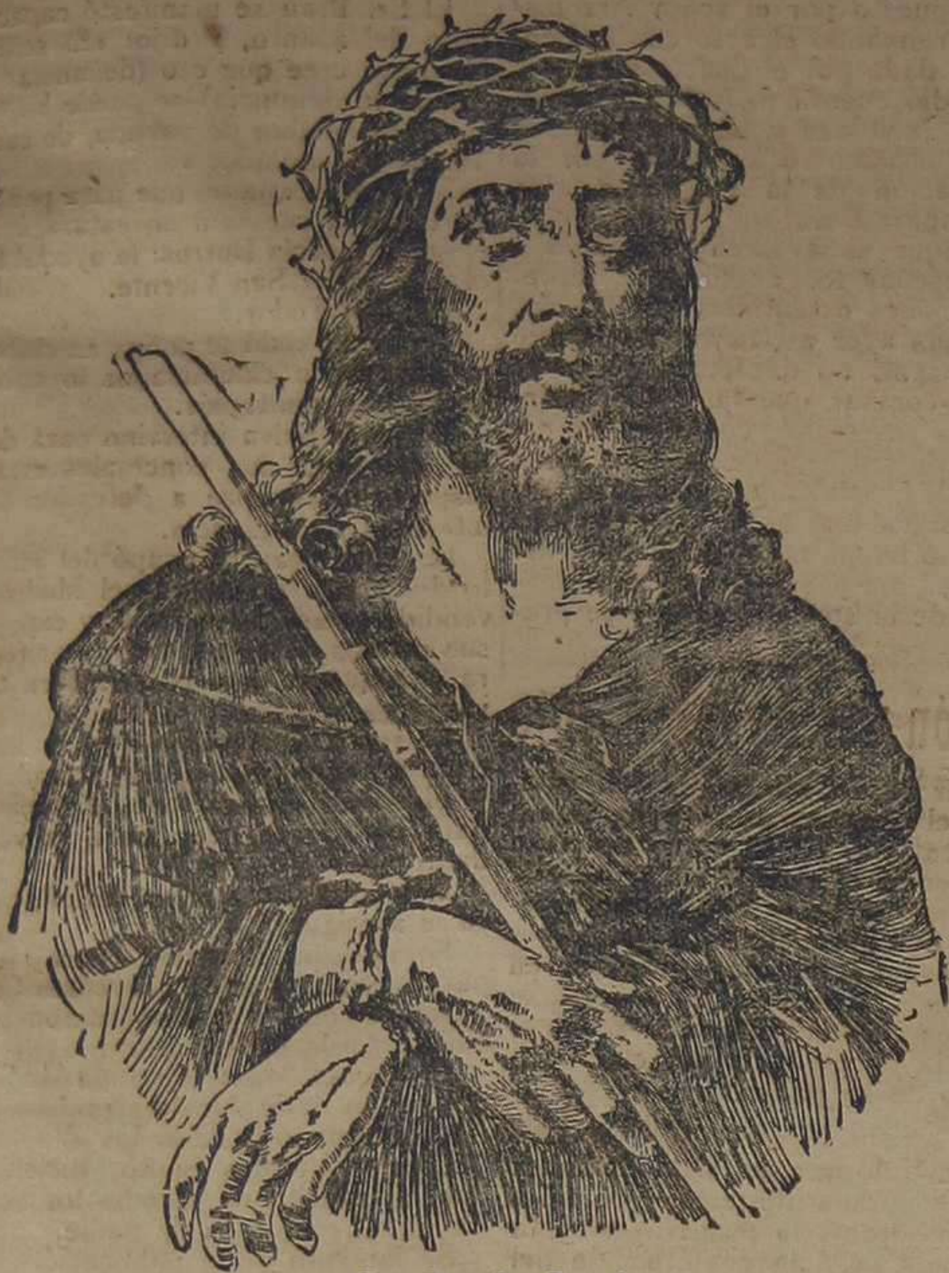
Cuadro de Crosi.