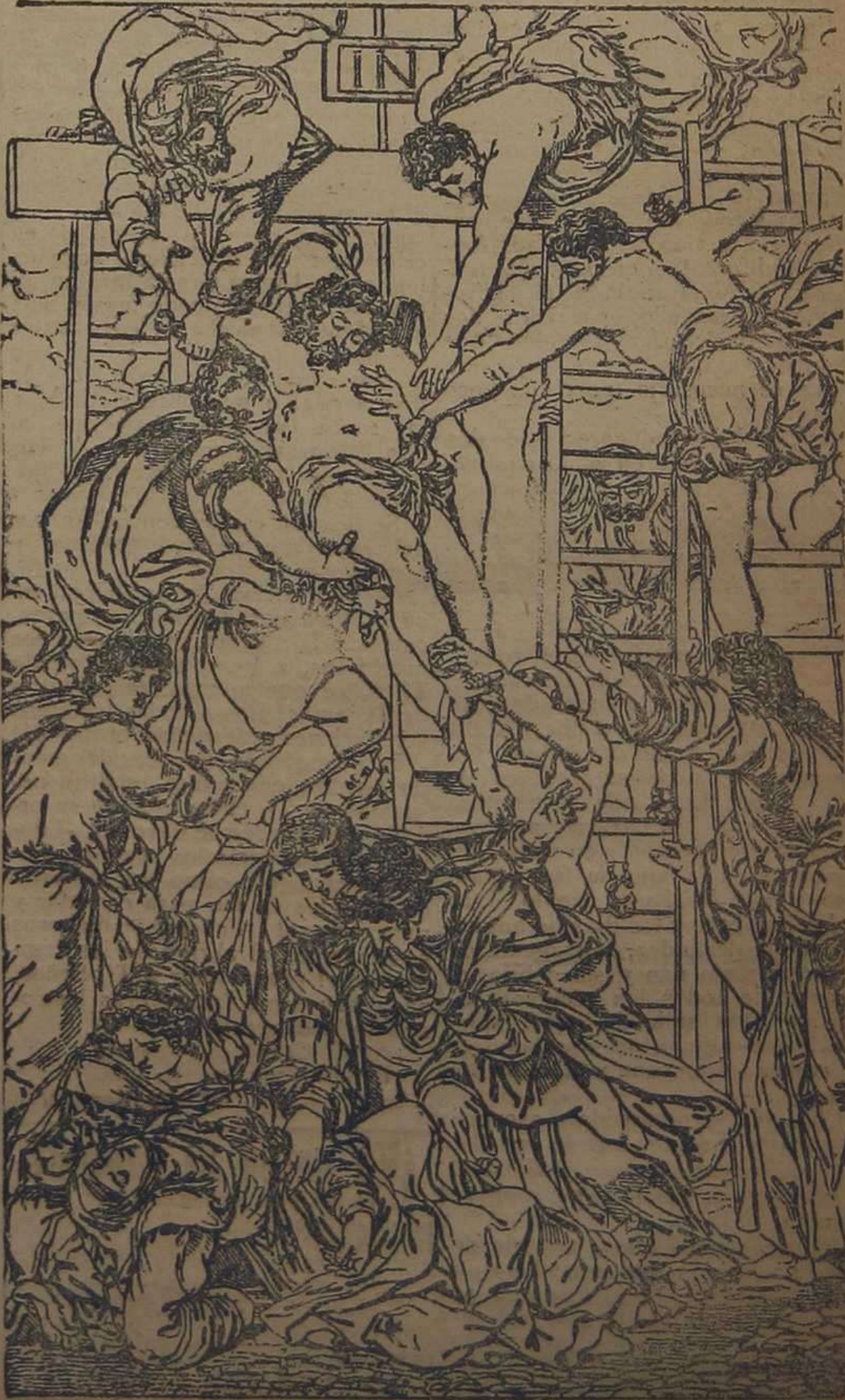
Admirable cuadro de Ricciarelli que se venera en Roma.