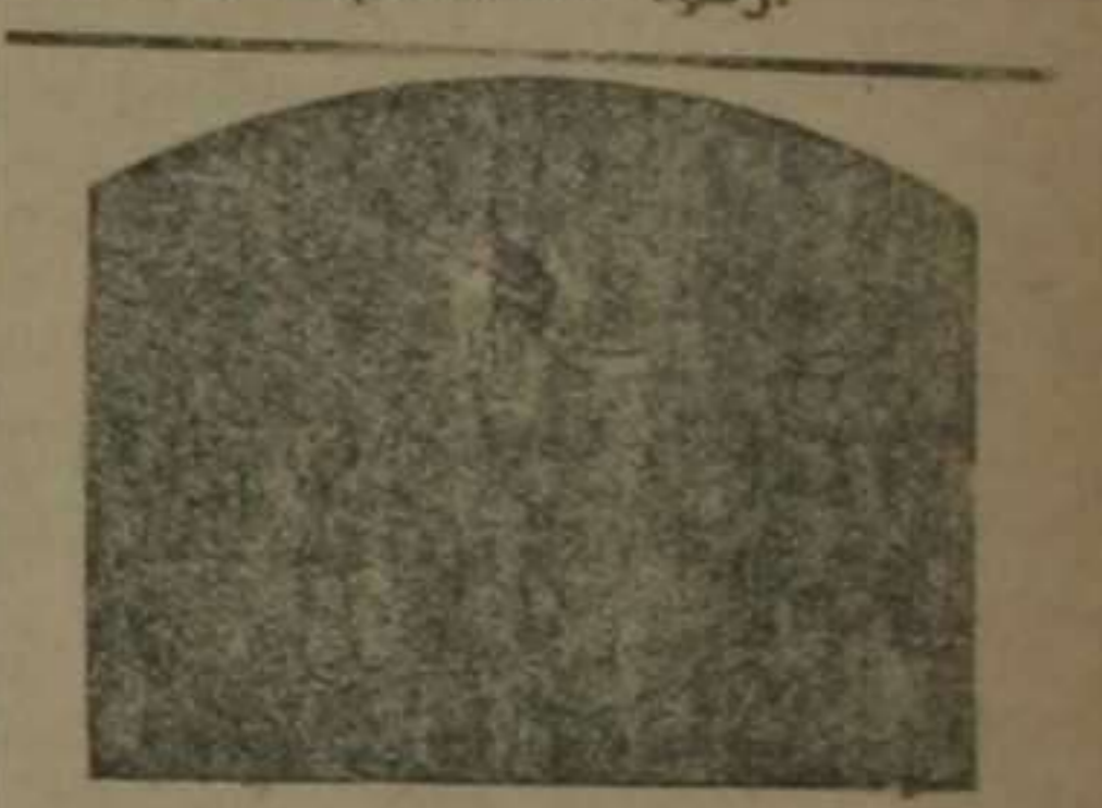
Exposición de lápidas, a precios sin competencia.