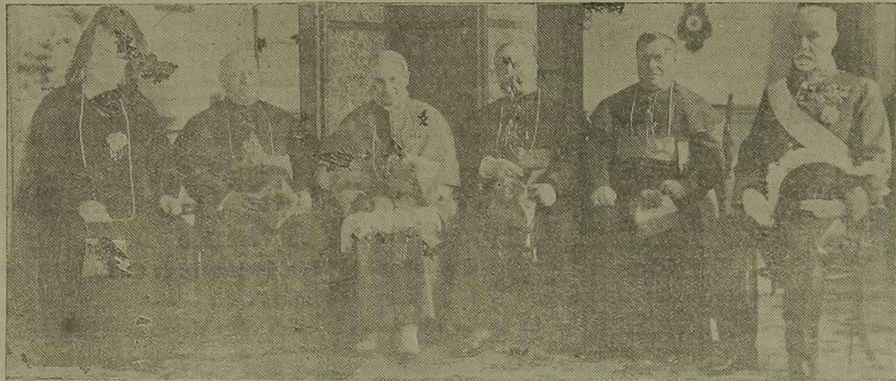
El nuevo Obispo con los Prelados consagrante y asistentes y padrinos, excelentes señores condes de Montornés