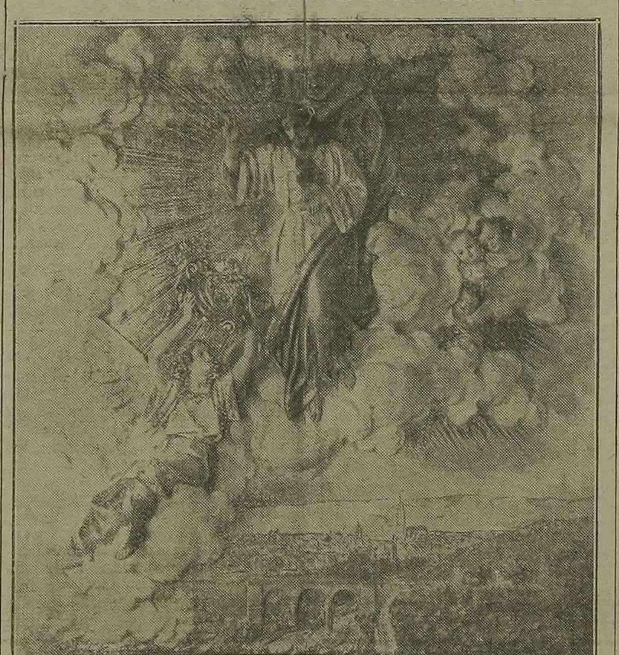
Hermoso altorrelieve del Sagrado Corazón que se colocará hoy en el salón de sesiones del Ayuntamiento de Onteniente