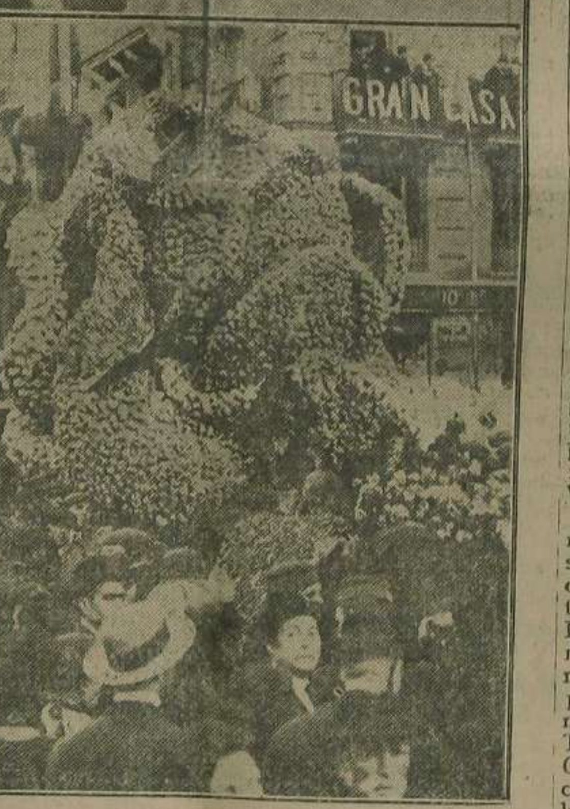
Carroza representando la Primavera