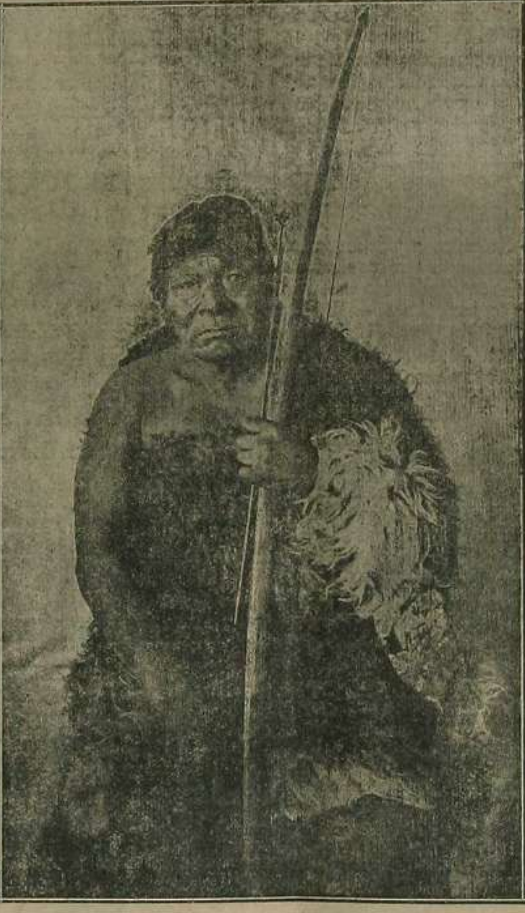
El Misionero, con la mirada llena de fe, puesta en las almas de nuestros hermanos infieles, evangeliza lo mismo a los cultos japoneses que a los salvajes habitantes de América del Sur, a cuya raza "ona", habitante en la Tierra de Fuego, pertenece el viejo del grabado, con su clásico arco y vestido primitivo

«Hoja de Propaganda Misionera» Se publica todos los meses