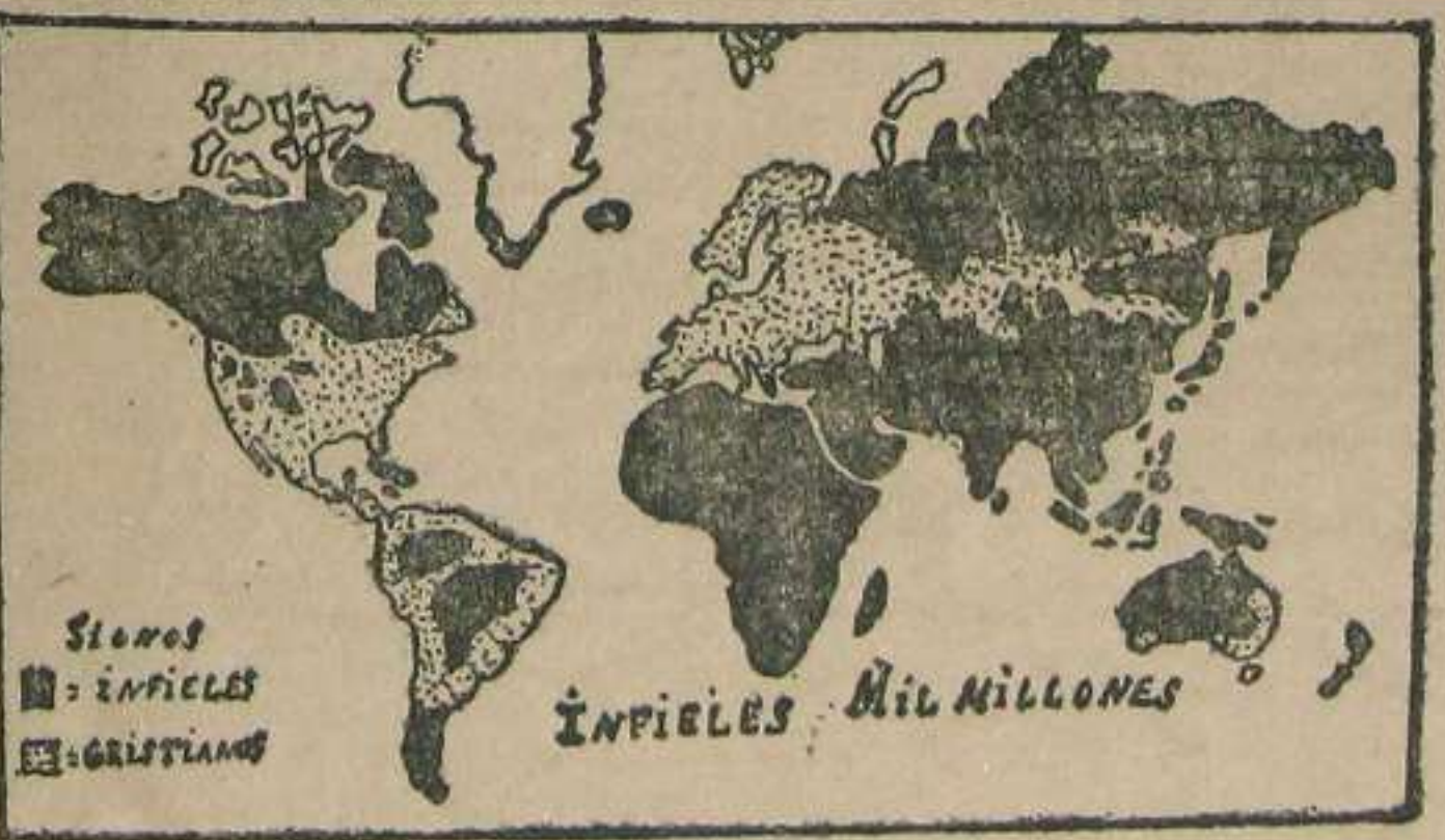
La negra mancha de la infidelidad, que cubre más de la mitad de la tierra, envuelve en sus tinieblas a mil millones de almas. (Señor, que te conozcas)