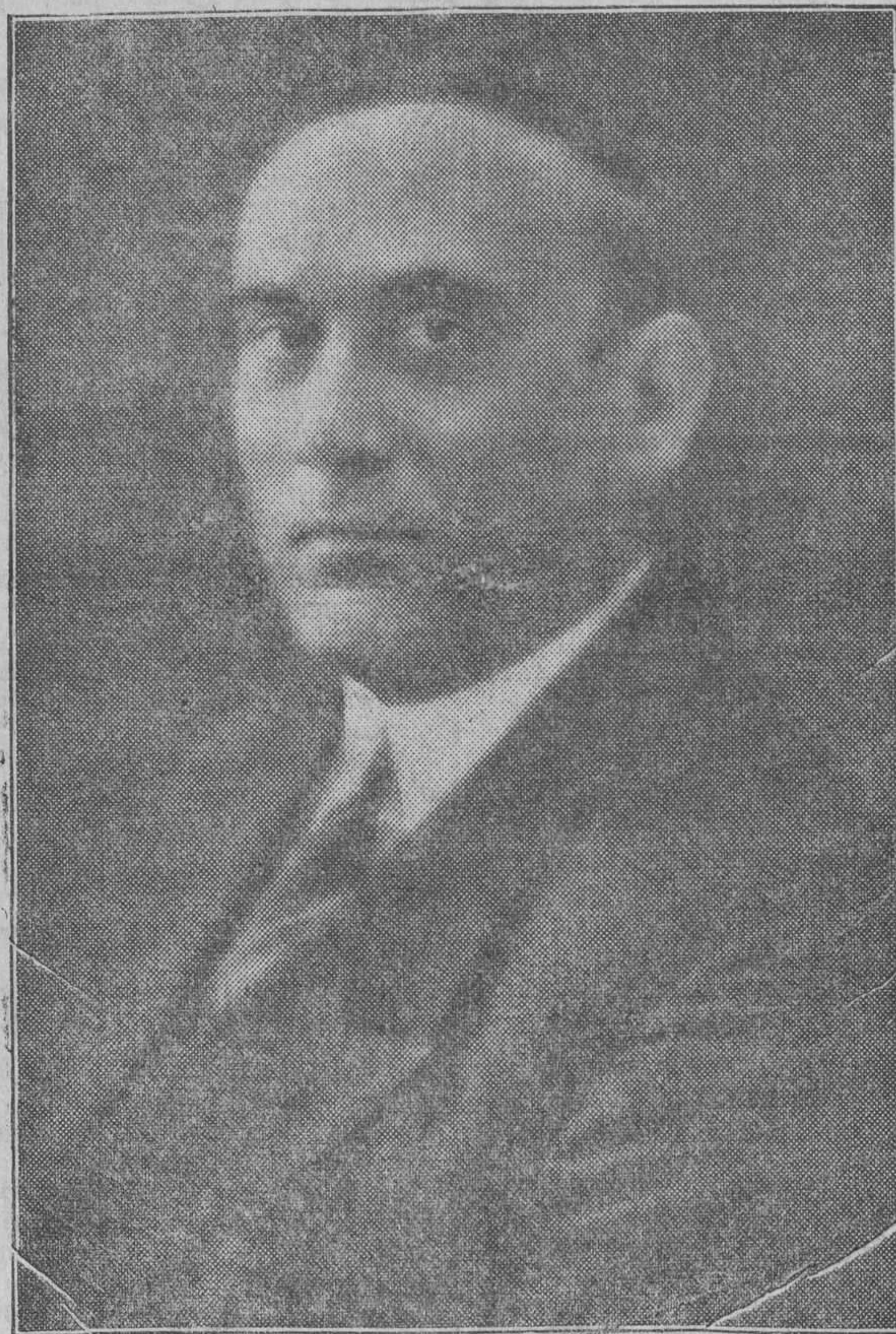
El aplaudido barítono EDUARDO FATICANTI