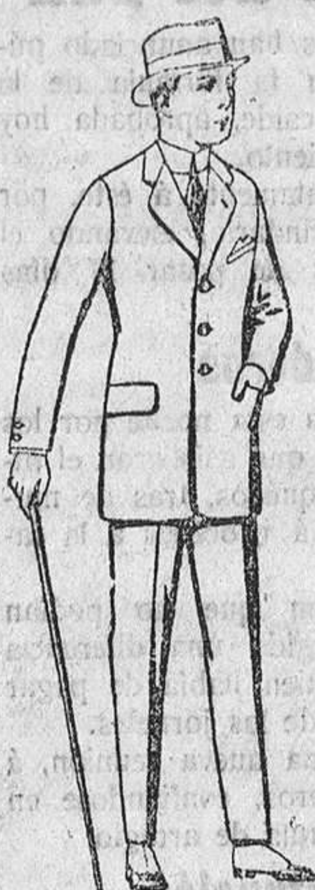
Trajes de patén, vicuña ó jerga, para niños de 10 á 12 años. De ptas. 37 á 83. Los mismos, para jovencitos de 13 á 16 años. De ptas. 40 á 85.