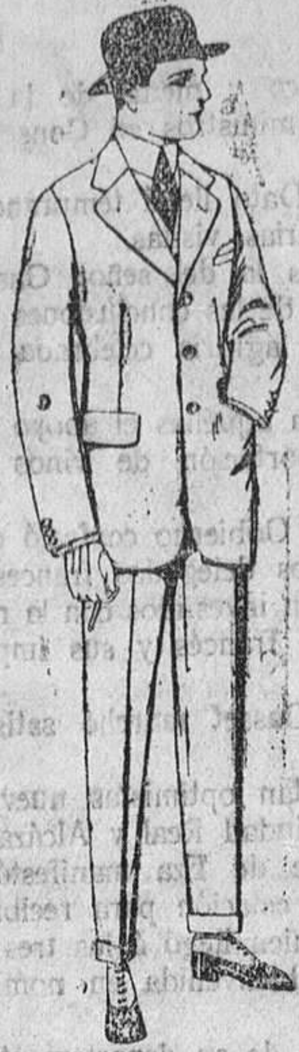
Trajes de cheviot, melton vicuña ó jerga. De ptas. 47 á 190.

Madrid, Barcelona, Alicante, Almería, Bilbao, Cádiz, Cartagena, Gijón, Granada, Málaga, Palma de Mallorca, Santander, Sevilla, Valladolid y Zaragoza.