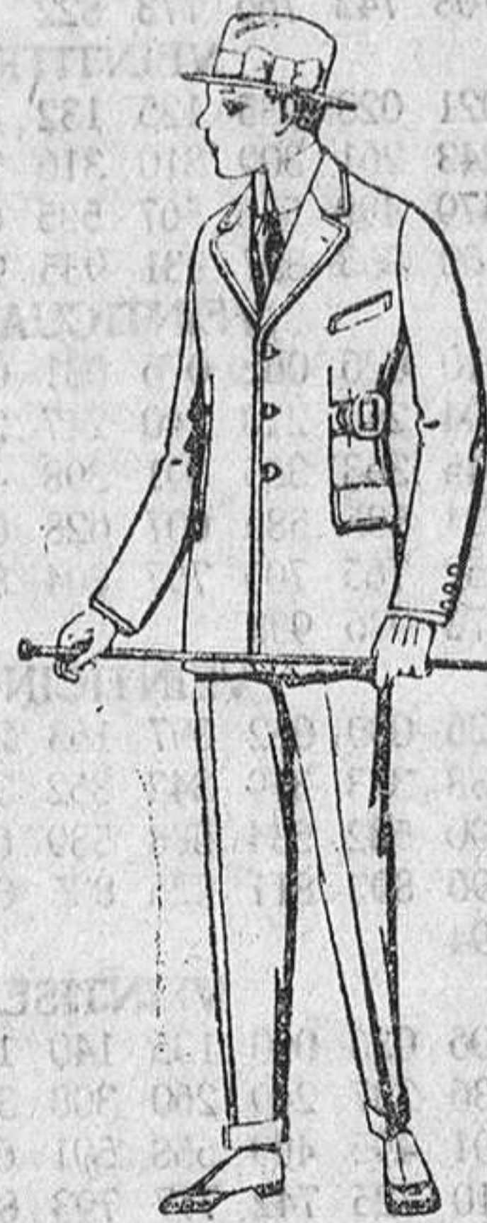
Trajes de patén, vicuña ó jerga, etc., forma sport, para niños de 10 á 12 años. De ptas. 45 á 83. Los mismos, para jovencitos de 13 á 16 años. De ptas. 48 á 87.