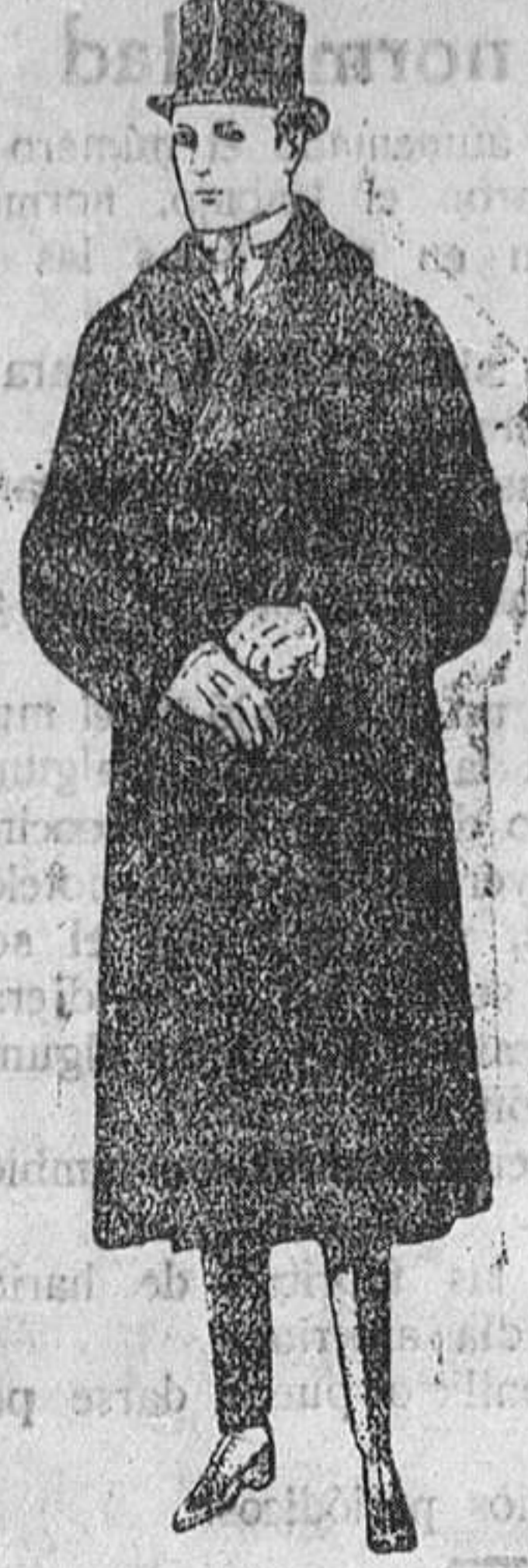
Gabanes de edredón negro, con cuello y vistas de piel. De ptas. 220 á 450.