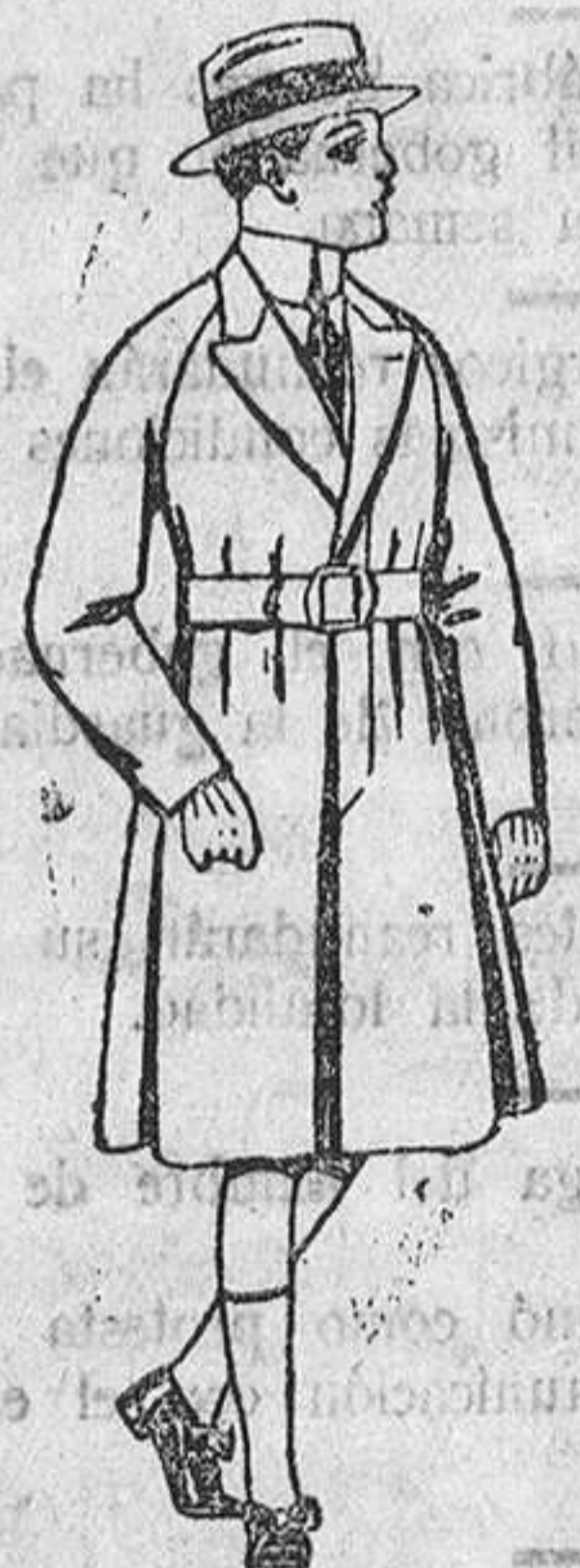
Gabanes de patén, para niños de 4 á 9 años. De ptas. 50 á 58.