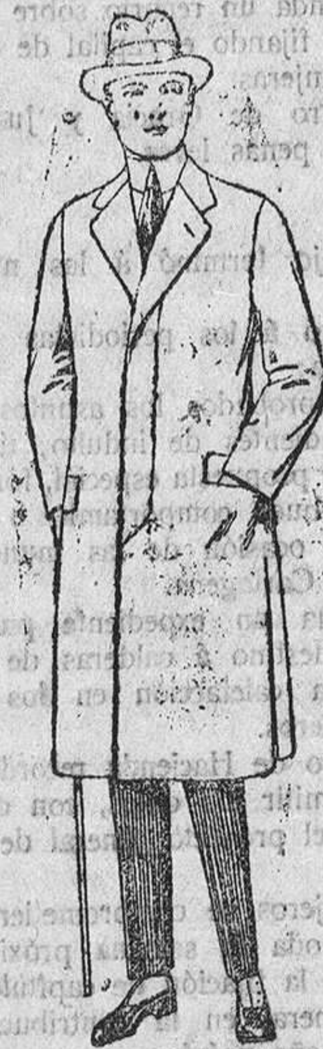
Gabanes de cheviot, gamuza, patén, etc. De ptas. 55 á 70.