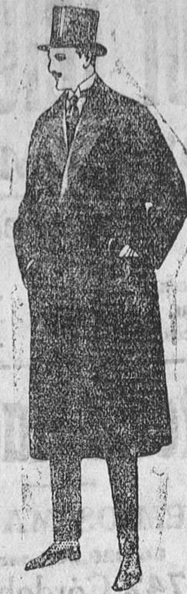
Gabanes de gamuza ó vigonia, con vistas de seda. De ptas. 175 á 220.