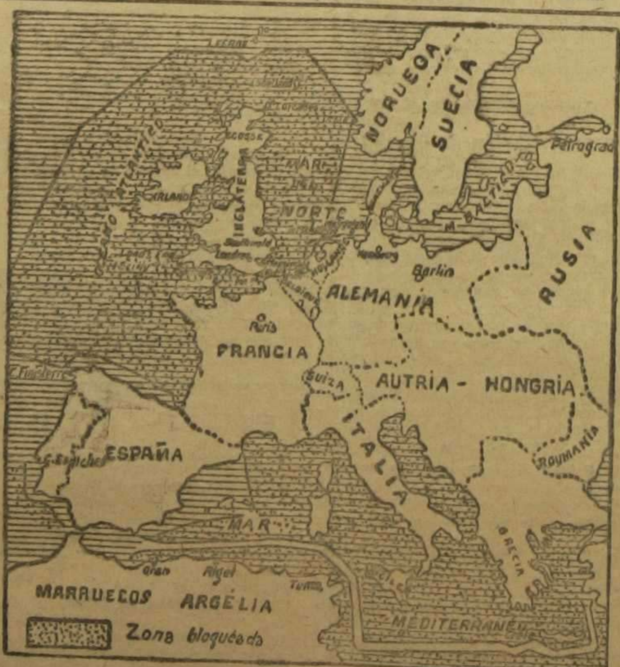
Gráfico de las zonas en que ha sido declarado el bloqueo por Alemania.