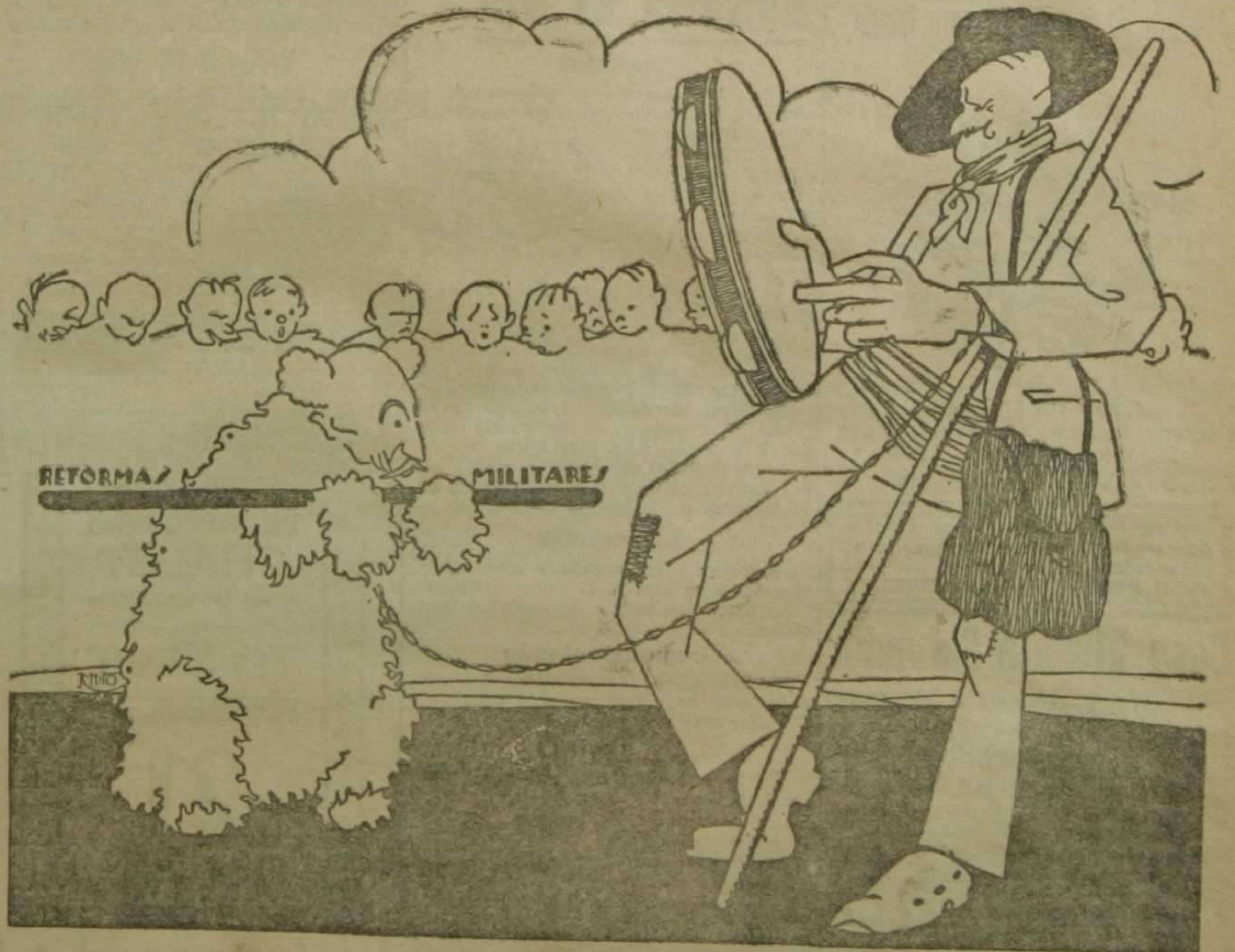
Puede el baile continuar

miembre DES DEL o difinitiva. a, así como la