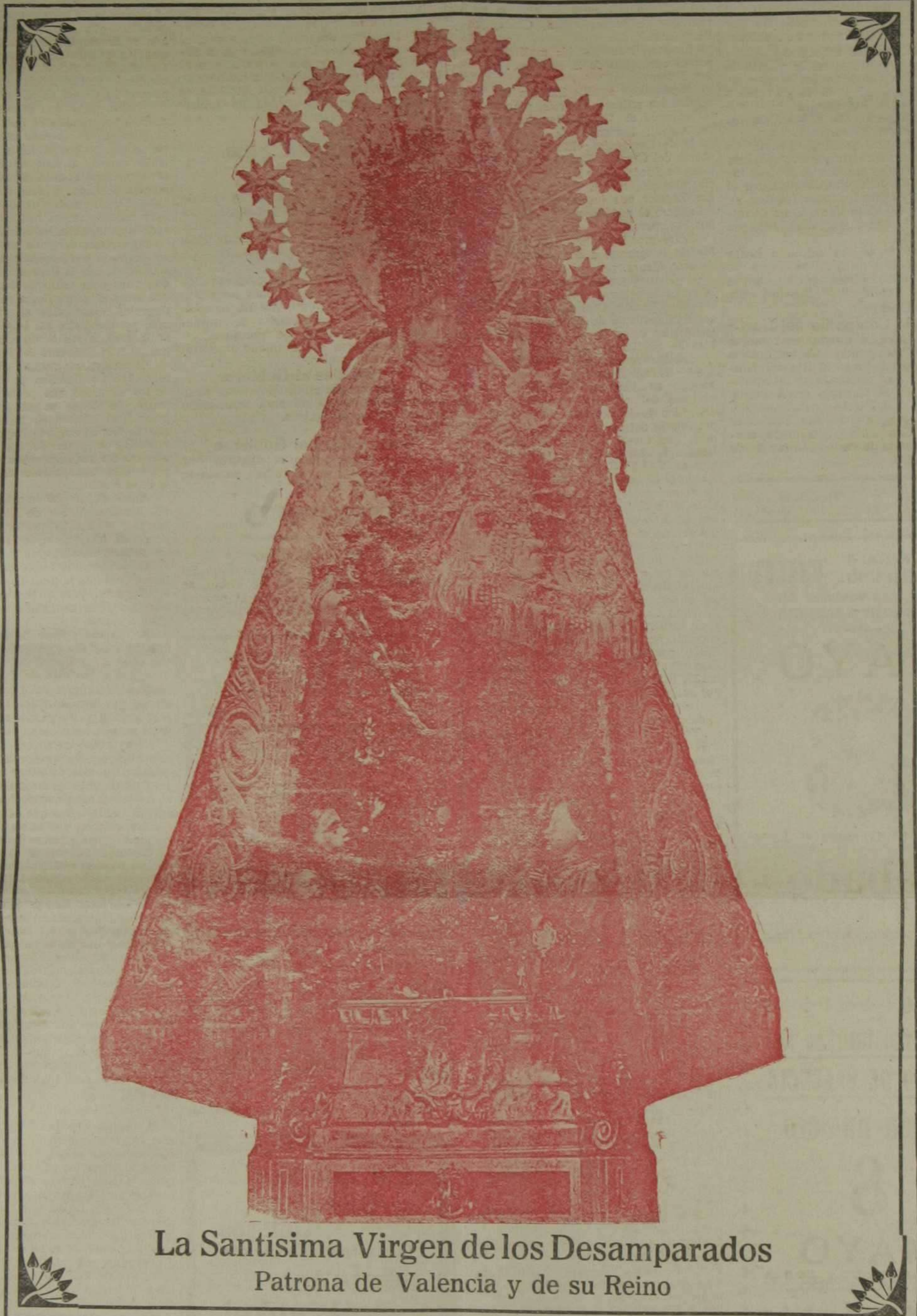
La Santísima Virgen de los Desamparados Patrona de Valencia y de su Reino