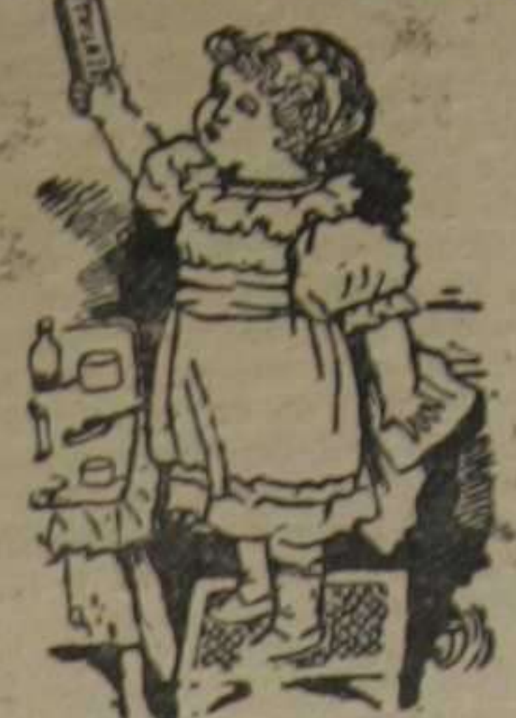
Caja-estuche una peseta