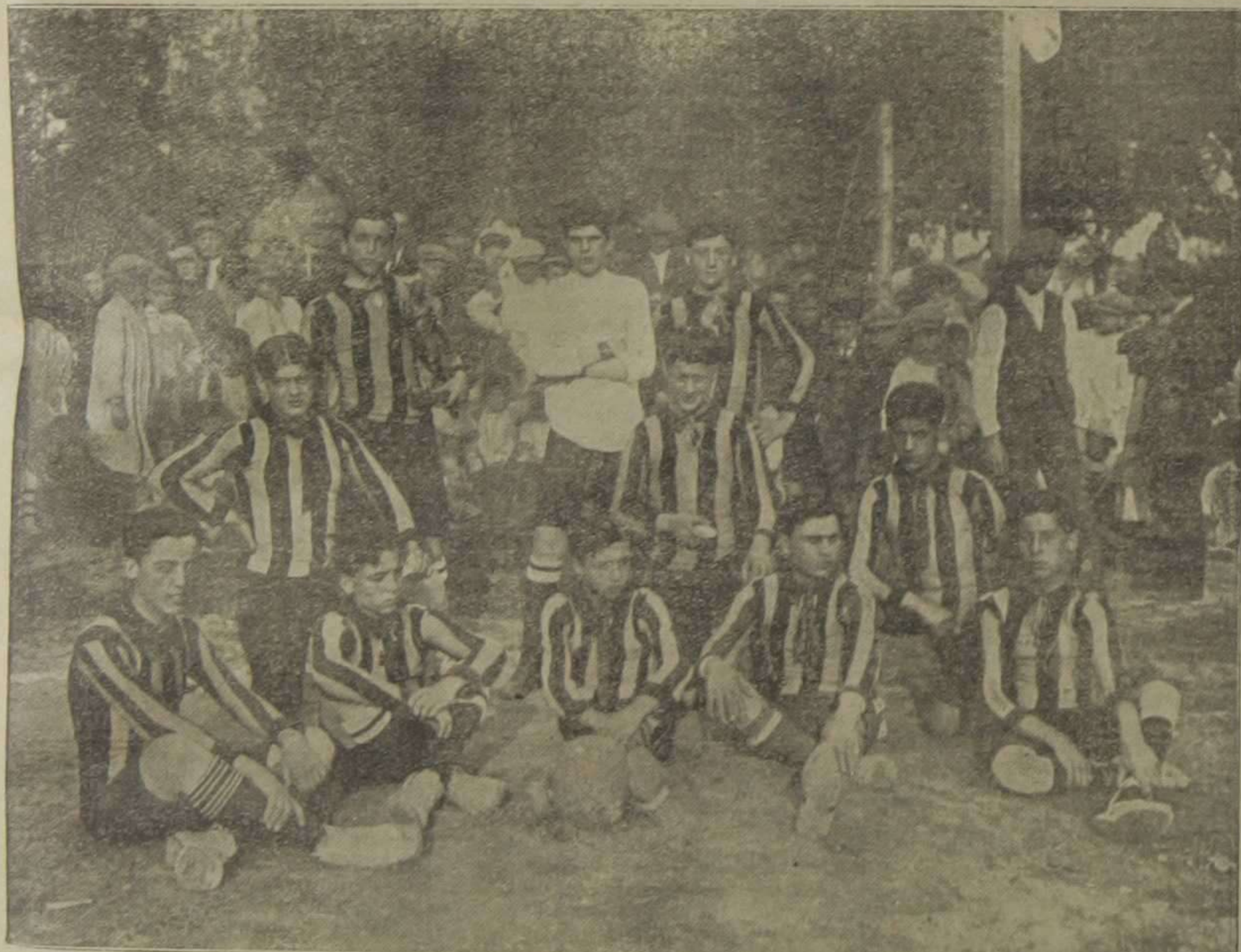
Primer equipo "Gimnástico" del Patronato de la Juventud Obrera de Valencia.—(Foto. Cabedo).