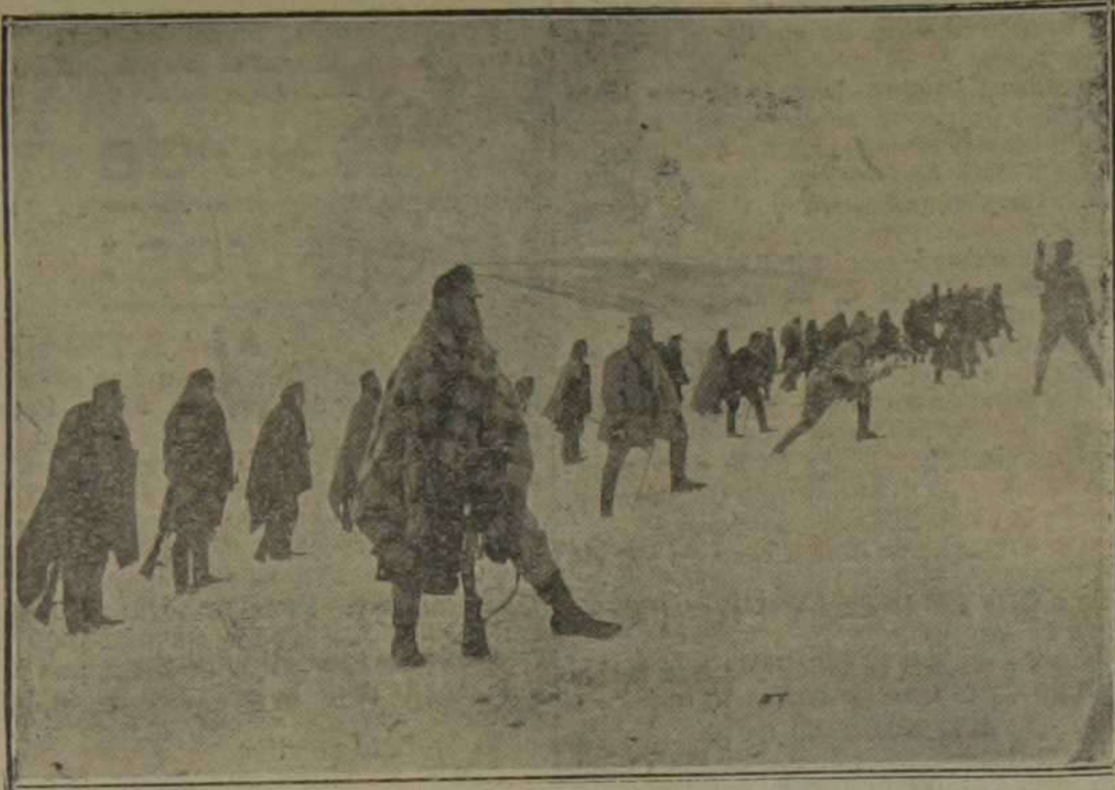
Avance de las tropas austriacas en los Cárpatos