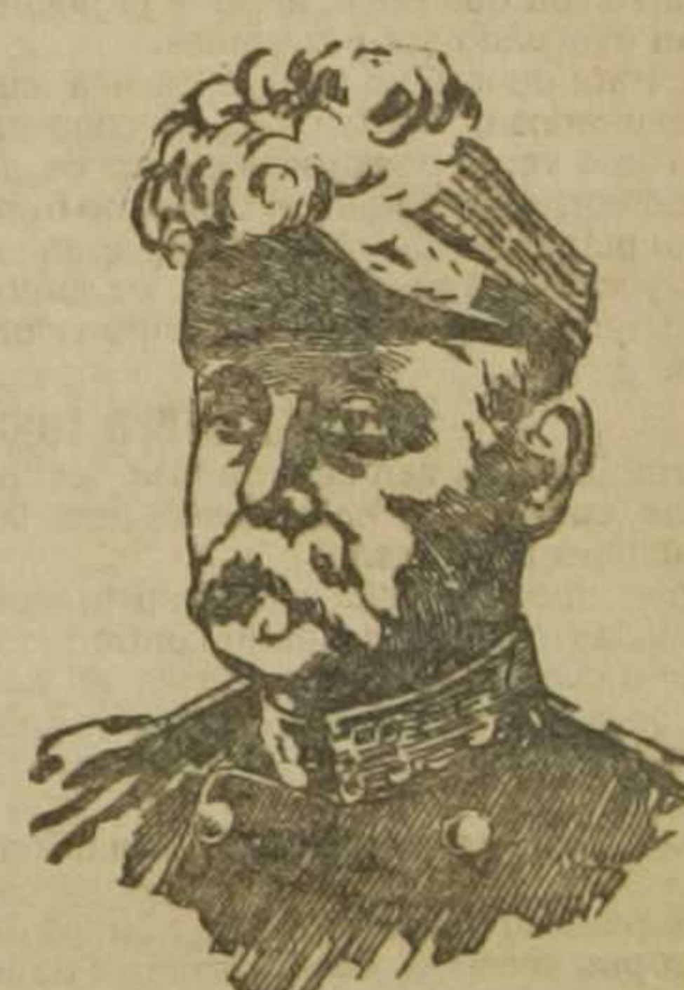
El general Pan

Comandante en jefe del ejército francés que opera desde la Lorena a Nancy