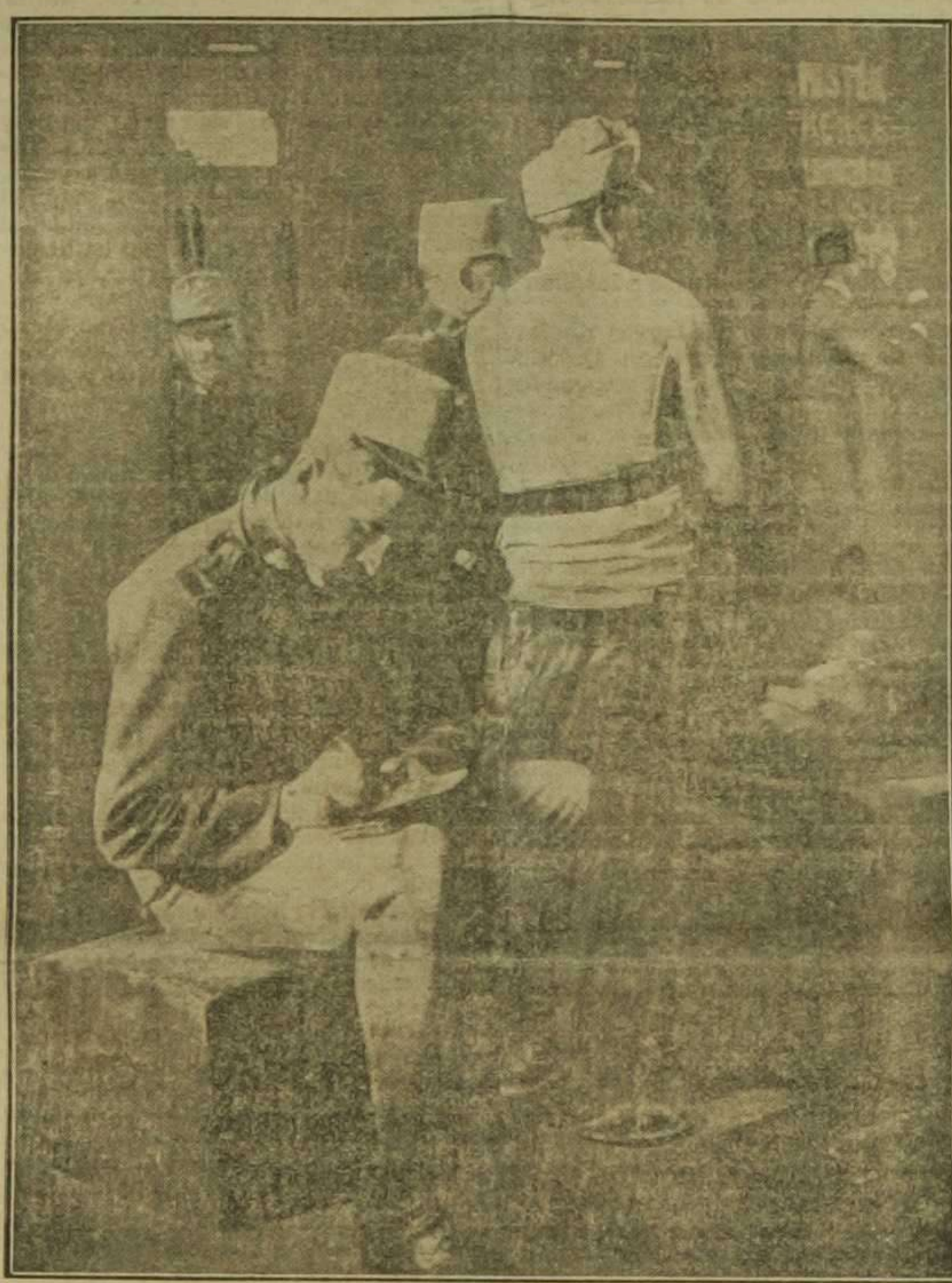
La última posta; momentos antes de partir para luchar contra los rusos.