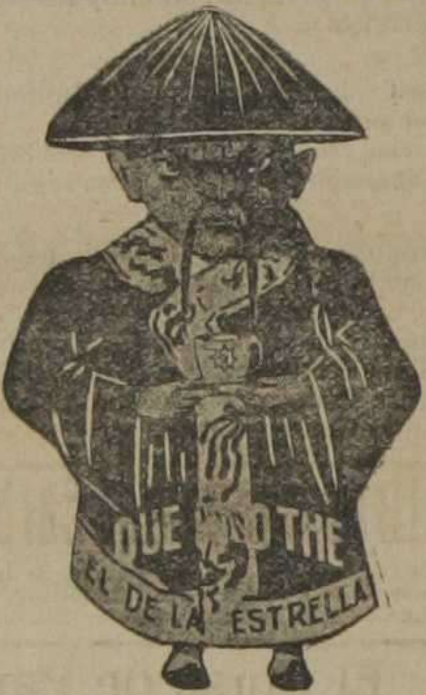
Desde Lima a Nueva York y de Peñón a Marsella. Todos dicen como yo que rico Thé, el de LA ESTRELLA.