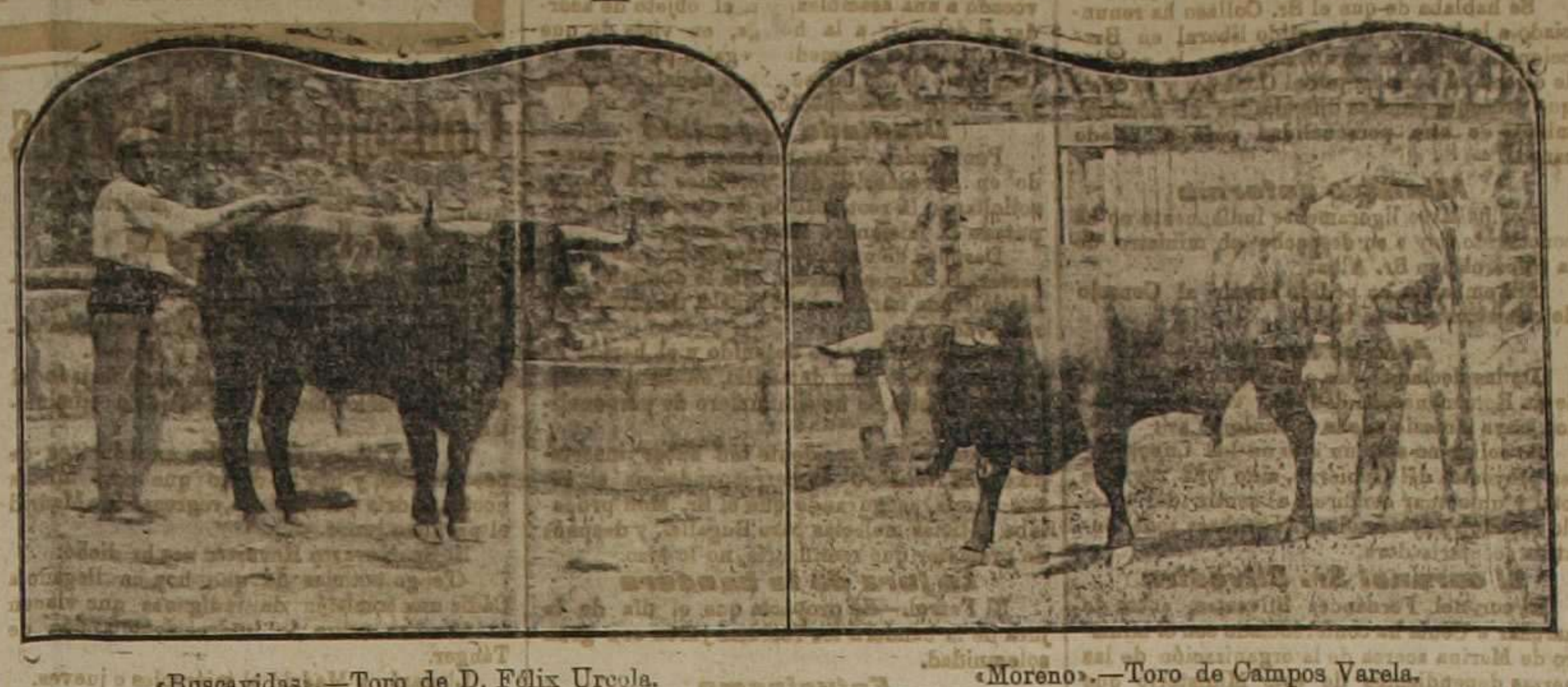
«Buscavidas».—Toro de D. Félix Urcola. «Moreno».—Toro de Campos Varela.

Un sugestionador de reses bravas El incomparable "Pepet"