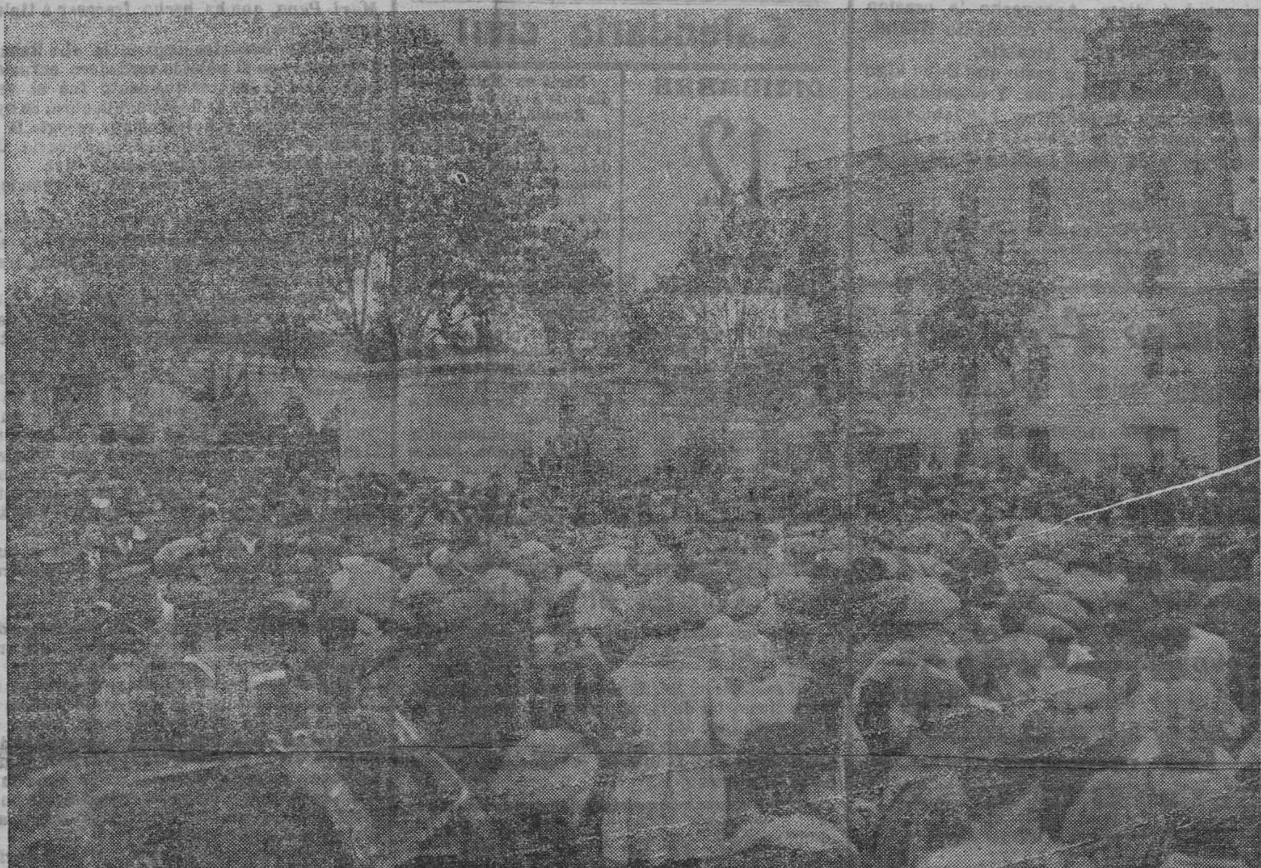
Aspecto de la estación del Norte á la llegada de los reservistas

En la conciencia de todos los republicanos está que de todas cuantas luchas electorales ha sostenido el partido de Unión Republicana Autonomista de Valencia, es la de hoy la más importante, la más trascendental, la que más poderosa é intensamente ha de influir en el desenvolvimiento, en la cultura y en la transformación de Valencia. Todos contra nosotros y nosotros contra todos... ¿Qué partido político, qué colectividad social puede ostentar altivamente su nombre que este que nosotros grabamos en nuestra bandera, triunfante en todas las contiendas y en todas las batallas que contra todos hemos sostenido?