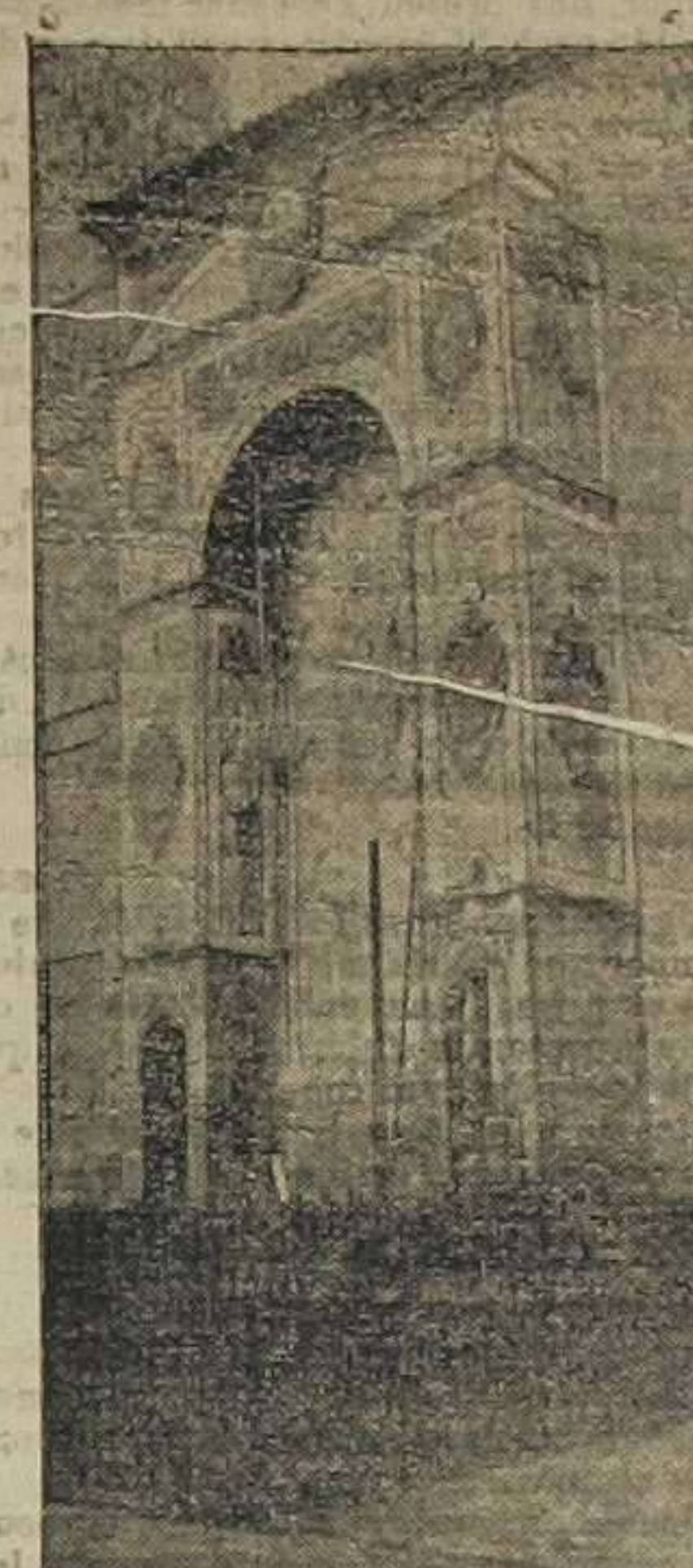
Plaza del Carmen