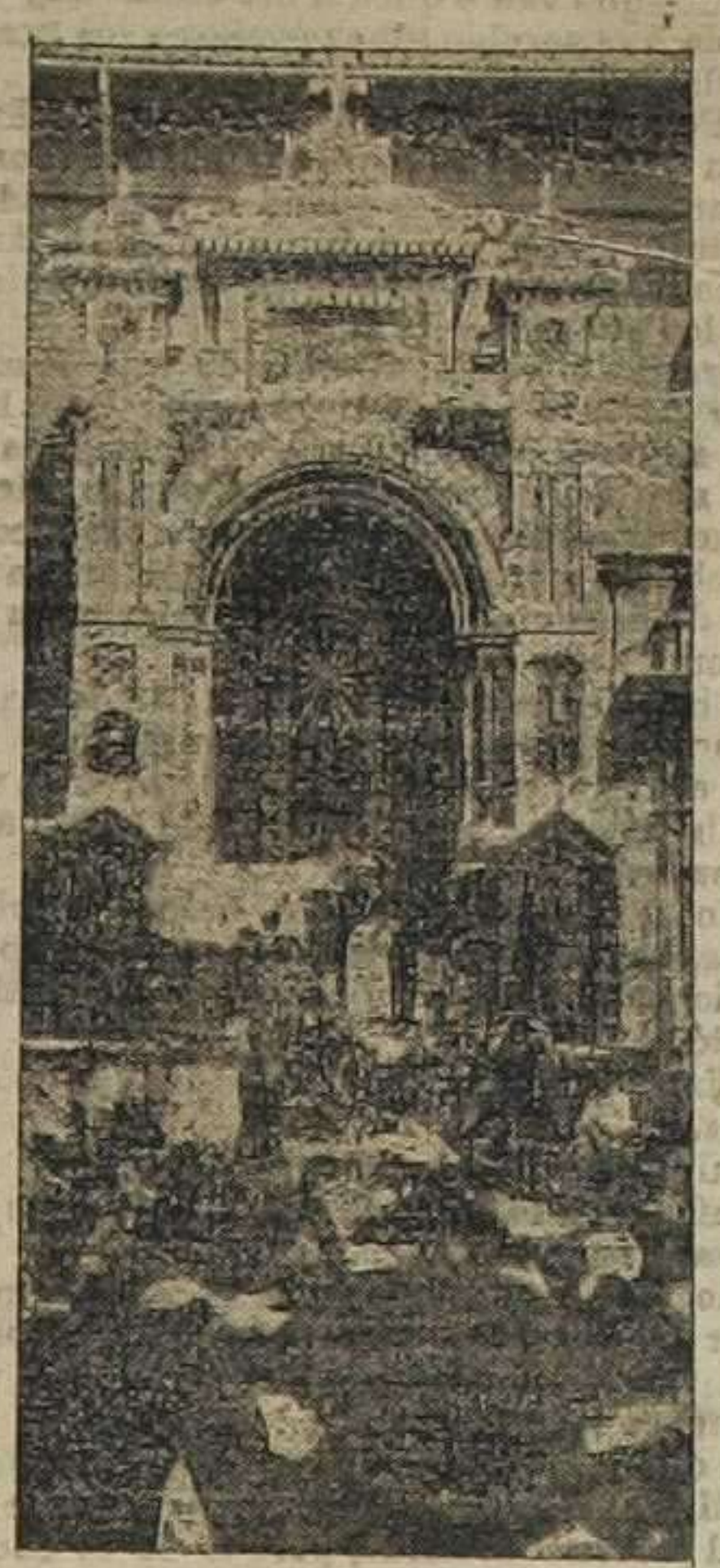
Plaza de la Virgen