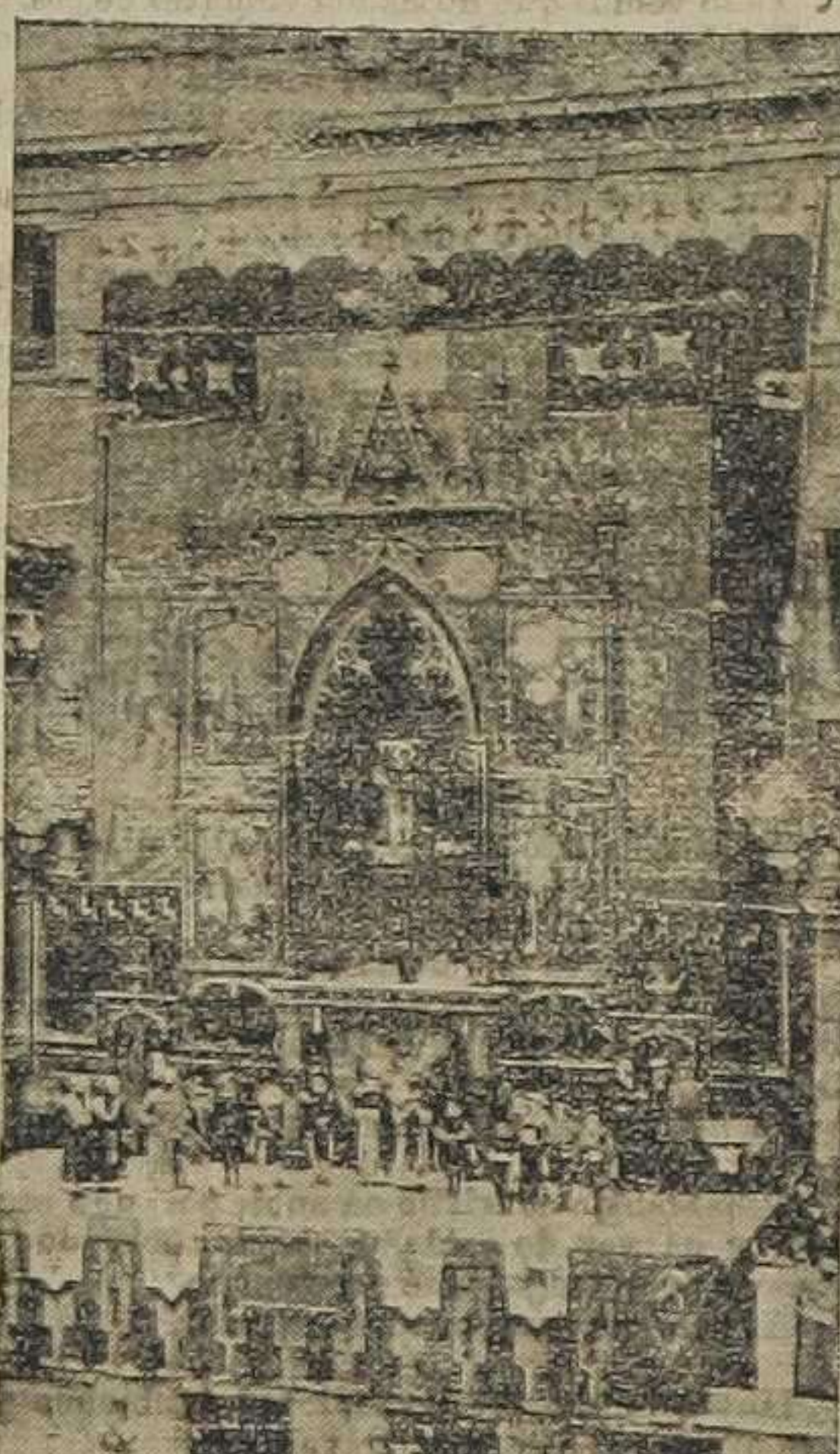
Plaza del Mercado