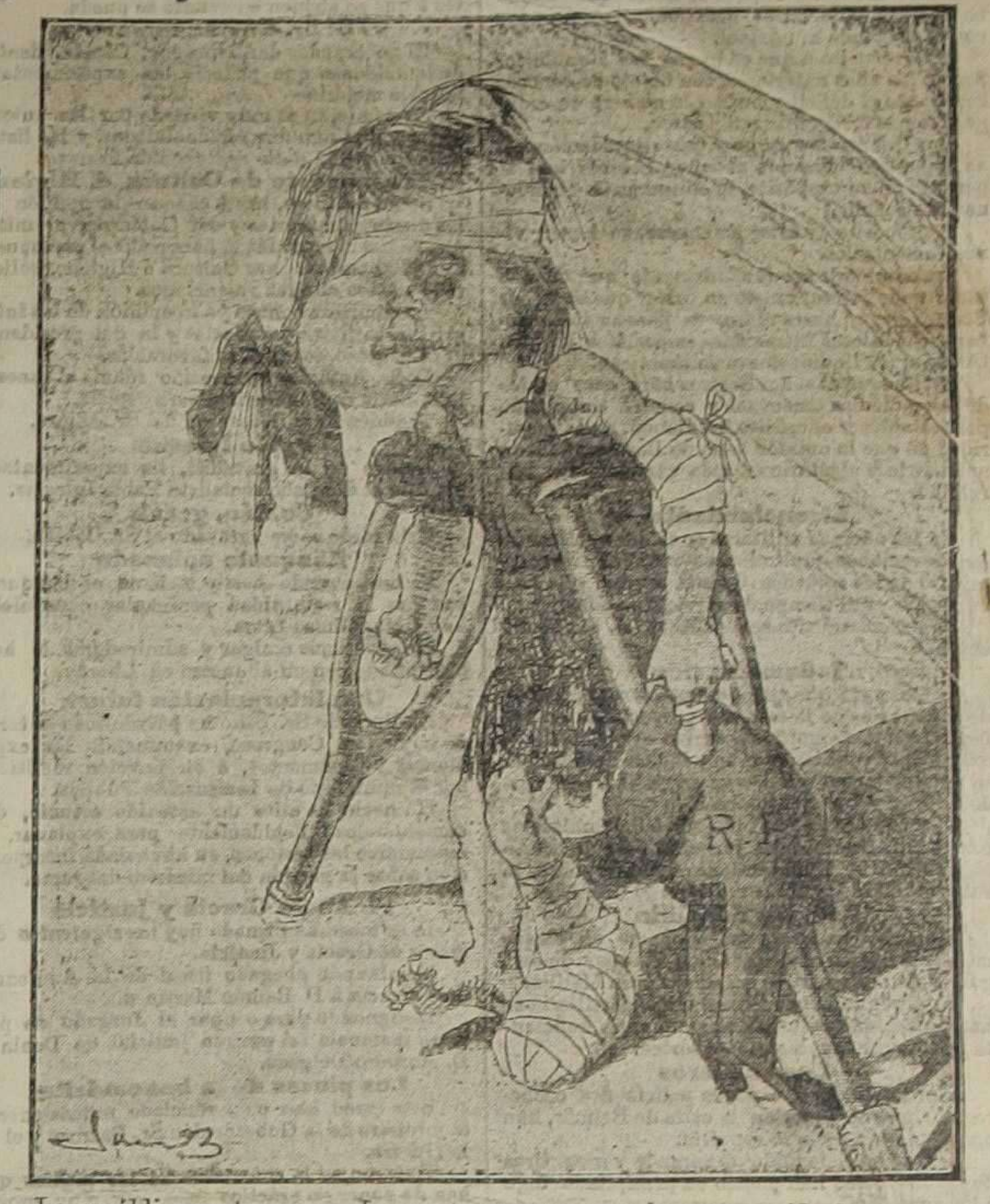
La república portuguesa.—La suerte es que ya me han reconocido las potencias. Hoy no me conocería nadie... (De «Cu-cut»)

La intervención británica Las relaciones tradicionales que existen entre Portugal y el Reino Unido son de un carácter tal que suponen para éste una responsabilidad moral en la materia. Portugal es aliado de Inglaterra, y si Portugal se empeña en violar de este modo los prin-