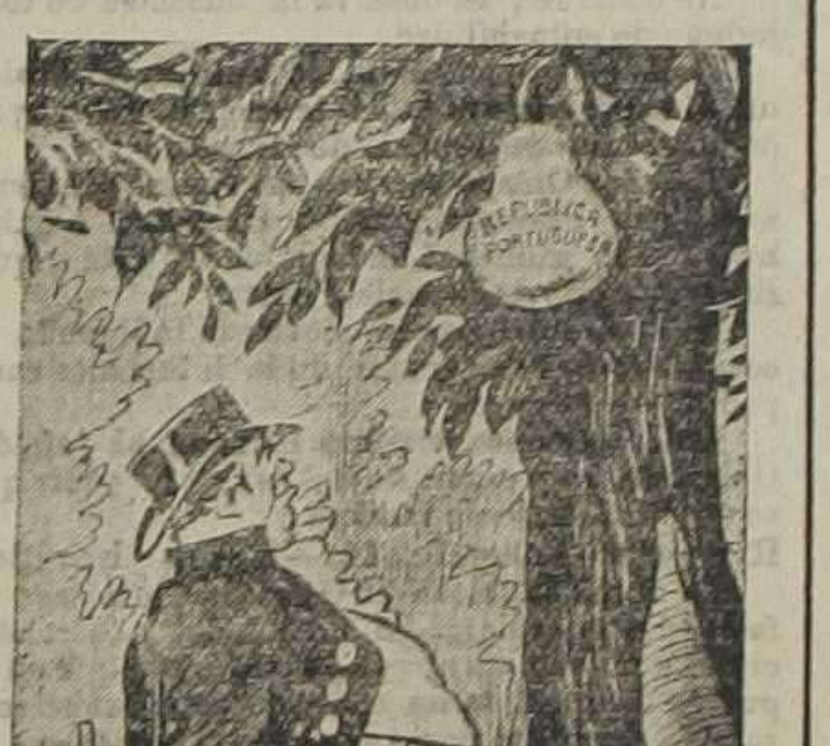
John Bull reflexiona. — Todavía no parece en sazón... Esperemos a qué está madura. (De «Gedeón»)

John Bull reflexiona. —Todavía no parece en sazón... Esperemos a qué está madura. (De «Gedeón»)