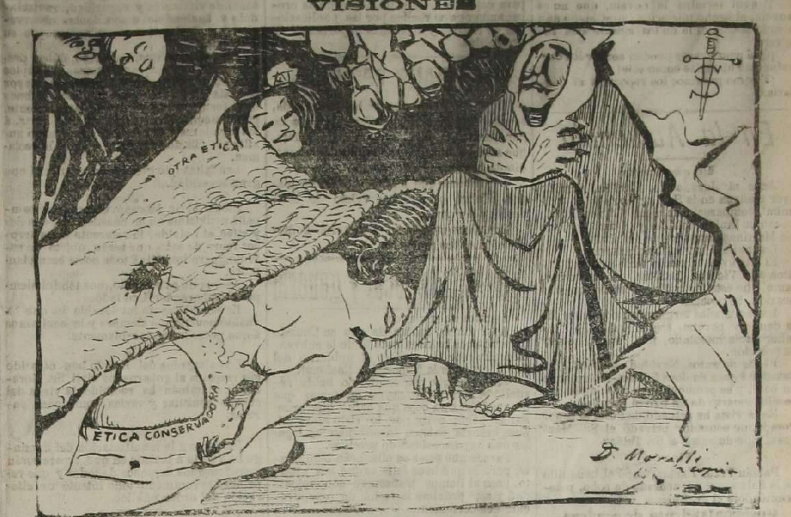
«La visión de D. Antonio» era una «visión profética», aunque se llevó el demonio aquella moral, y esta ética.

El Mercado Central. El alcalde ha interesado de la comisión de Mercados formule con urgencia la redacción del pliego de condiciones económicas y facultativas para abrir el correspondiente concurso a fin de que se presenten proyectos para la construcción del Mercado Central, ya que el primer concurso no dió el resultado apetecido. He llegado tarde... Ya tenemos a mister Arrow en Marsella. Su primera idea fue dirigirse al Hotel Termínus. Había oído en su viaje y en la misma Marsella ciertas conversaciones que le habían infundido sospechas. Llegó. «¿Sabe usted?» preguntó el mozo—si