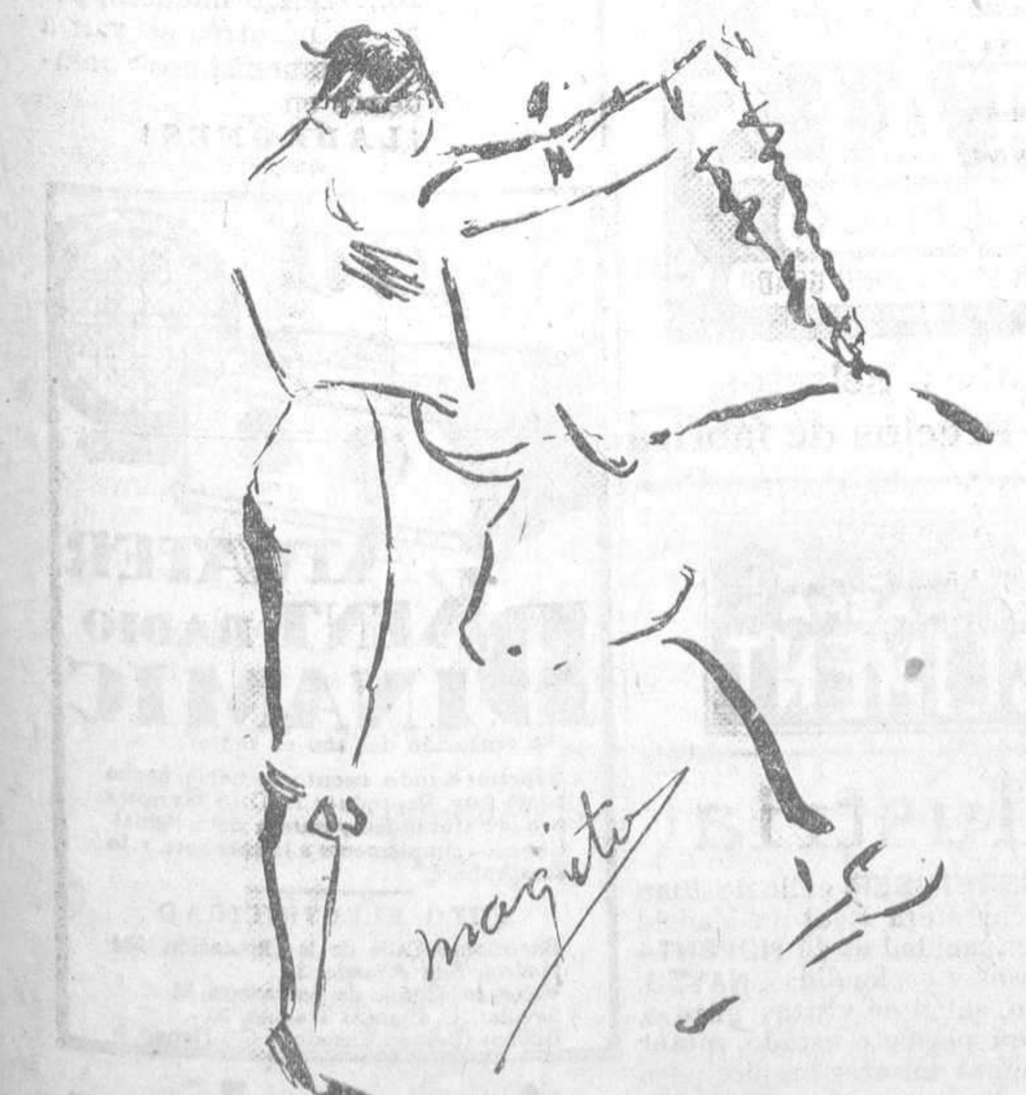
Un par de Torón

con su cabalgadura y caído al descubierta; Aldeano agarrado a la cola del bicho y Amorós sacando a éste del sitio de peligro. —Paco Gómez fué ovacionado. En el cuarto, resentido de los remos y de la vista, toroé de capa Aldeano a la defensiva, viéndose acosado. Acusó su nota de valiente en quites, y aunque en el trasteo dió tres naturales, valeroso, mas con poco mando, la faena resultó monótona. Un pinchazo, perdiendo la flámula, más pases y un desarme y una estocada, mojóndose la mano y cayendo el bicho hecho polvo. Y volvieron a ovacionario. Por la cogida de Torón hubo de despachar al quinto, el castaño bien armado y con poder. Aquí afirmó sus arrostos Aldeano, compitiendo con Amorós en los quites de las seis varas por tres caídas y un caballo para el arrastre. De tal modo dejaba llegar el «ché», embrazándose y sacándose al toro de la faja, que más de una vez creíase inminente la cogida. La valentía y el pundonor de este joven arrancaron entusiastas ovaciones. Llevó a su primer novillo hacia los medios, y allí lo toroé a placer con irreprochable estilo. Un quite por farolés y media verónica, para pintada por Carlos Ruano, y otro ejecutado con gentileza sugestiva. Este muchacho nos recordó ayer varias veces al pobre Granero, toroéando de capa y con la muleta. El público sentíase cautivado, y en los olés y aplausos había tanto de admirativo como de emoción. —Vengan los palos.