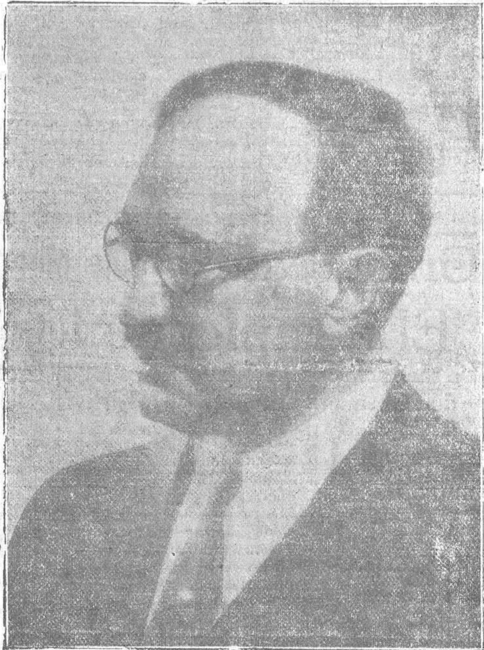
EL GLORIOSO NOVELISTA

Enrique Malboisson. Datos biográficos La vida militar de Primo de Rivera Don Miguel Primo de Rivera nació el 3 de Enero de 1870 en la casa número 13 de la calle de San Cristóbal, de Jerez de la Frontera. El año 1882 trasladaba su residencia a Madrid, donde comienza la carrera de ingeniero que abandona para dedicarse a la de militar. En 1894 viste por primera vez el uniforme de cadete de la Academia militar de Toledo. En 1899 es ascendido a alférez y destinado al regimiento de Extremadura. En 1890 asciende a teniente y destinado al batallón de Cazadores de Puerto Rico. Se le destina nuevamente al regimiento de Extremadura que se traslada a Africa y en 1893 Primo de Rivera obtiene nuevo ascenso a capitán. En 1895, el general Martínez Campos, al ser destinado a Cuba, nombra ayudante suyo a Primo de Rivera, que hace buena parte de la campaña de aquel territorio, ascendiendo a comandante en Diciembre de 1895. Hay un breve descanso y Primo de Rivera regresa a España, pero a poco de nuevo va trasladado a Cuba, donde su tío el marqués de Estella, al ser nombrado general en jefe del ejército de Filipinas en sustitución del general Polavieja, le nombra ayudante en 1897. En el mismo año obtiene el mando del batallón de Cazadores número 3 y también por otro hecho de armas asciende a teniente coronel en el mismo año.