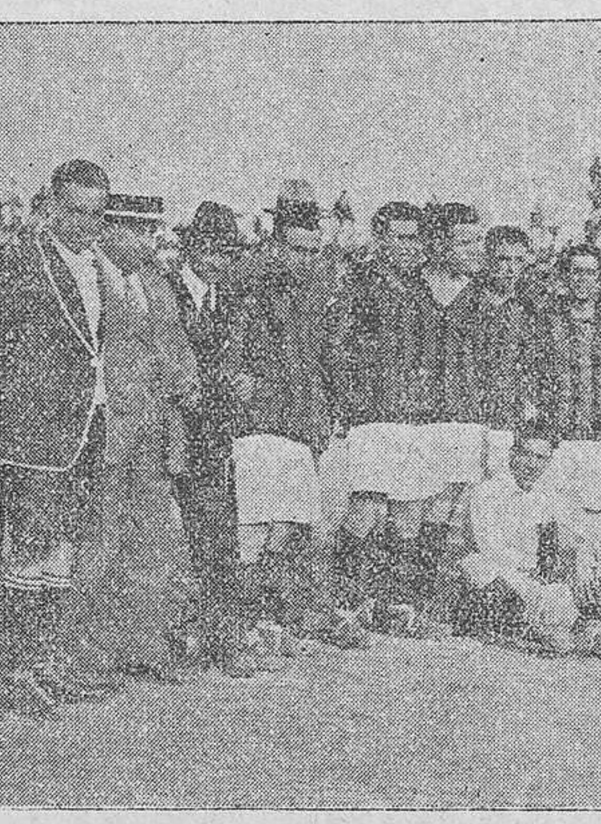
El Fiorenti, de Génova

Apenas comenzó el juego atacaron los del Praga, que rápidamente llegaron á la puerta de Oliva, dando lugar á que éste interviniere oportunamente. Hubo un corto espacio de tiempo, durante el cual ambos equipos no se emplearon á fondo, tanteándose las fuerzas; sin embargo, pudimos apreciar una mayor cohesión y empuje en los checos, que á pesar de no atacar deliberadamente, dominaron de ostensible manera á los genoveses. Se puso de manifiesto la inferioridad de los italianos, cuando á medida que el partido transcurria, contrastando con el aumento de ímpetu en su juego de los checos, el decaimiento se apoderó de ellos y siempre, á partir de aquí jugaron por la iniciativa y esfuerzo personal de cada uno de ellos. A los veinte minutos de juego consiguieron