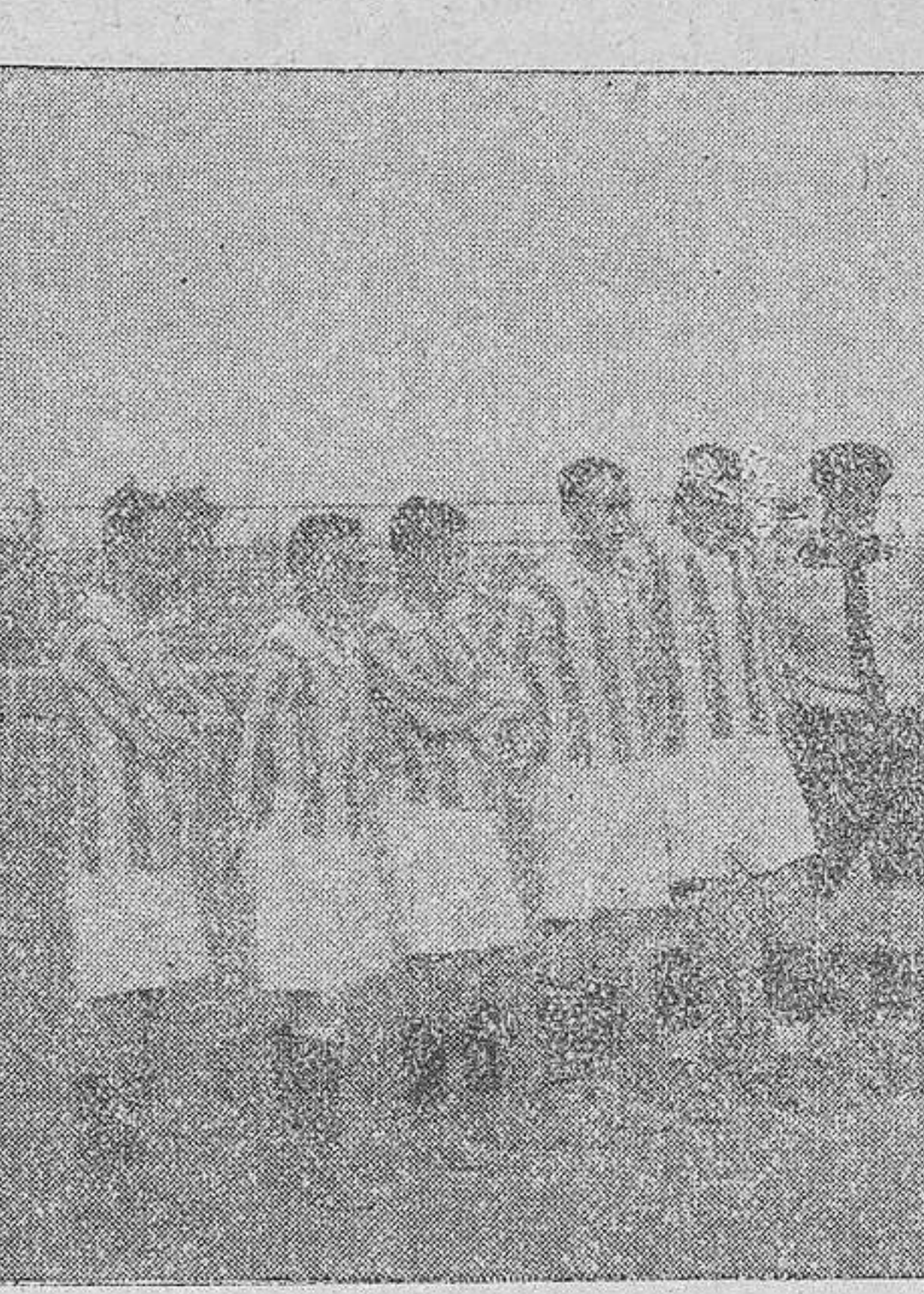
Meteor VIII de Praga