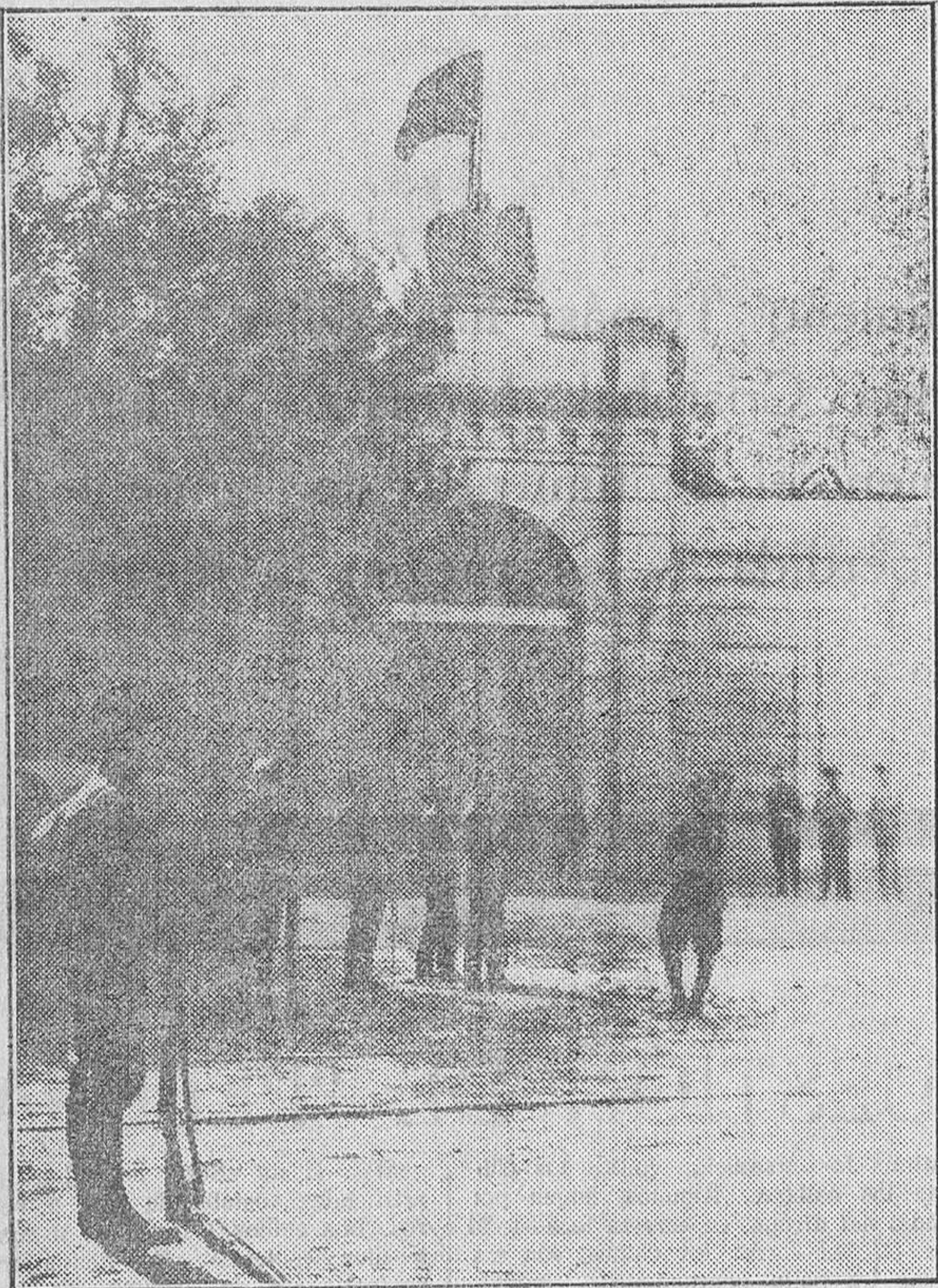
El momento trágico de la fatídica señal

Las coincidencias son las que me han traído aquí. En este momento, alguien le dijo al reo: —Me admira su entereza. ¿Es orgullo ó soberbia? —A lo que respondió: —Nada ni nadie me ha de salvar, así es natural que no me acobarde. Puesta ya la argolla, dijo al verdugo: —Esto ya se hace largo. Apríeta pronto y fuerte. Señores, salud, sa... No pudo terminar su saludo, el desgraciado, que cortó el verdugo haciendo rodar la manivela. Eran las 10.20 de la mañana. El cuerpo tardó unos cinco minutos en cesar sus convulsiones, y luego de certificar el médico la defunción, fué encerrado el cadáver en un féretro de pino negro y trasladado á una habitación carcana.