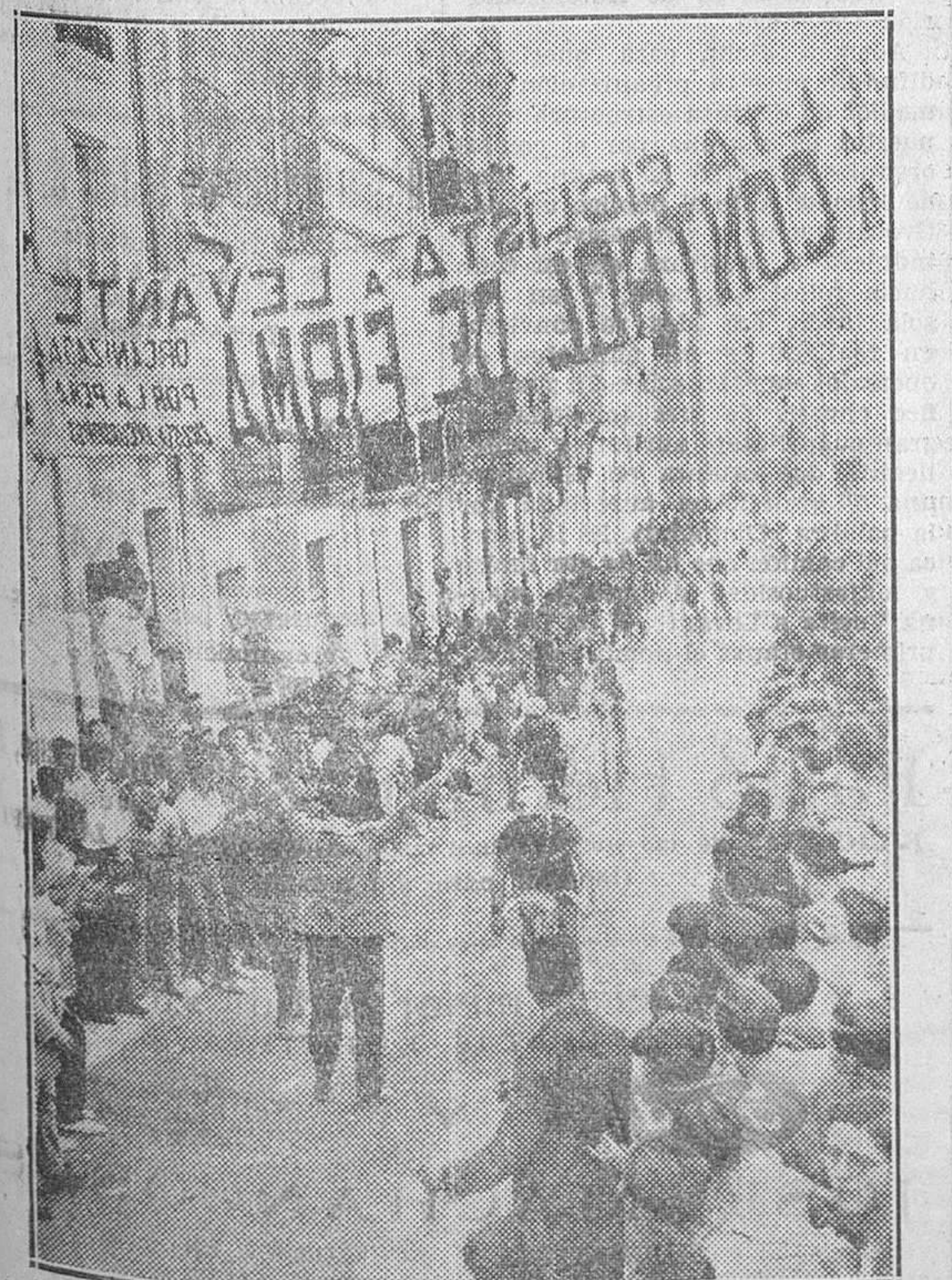
El pelotón de cabeza hace alto en el control de firma y revituallamiento de la segunda etapa, tributándose un recibimiento entusiasta