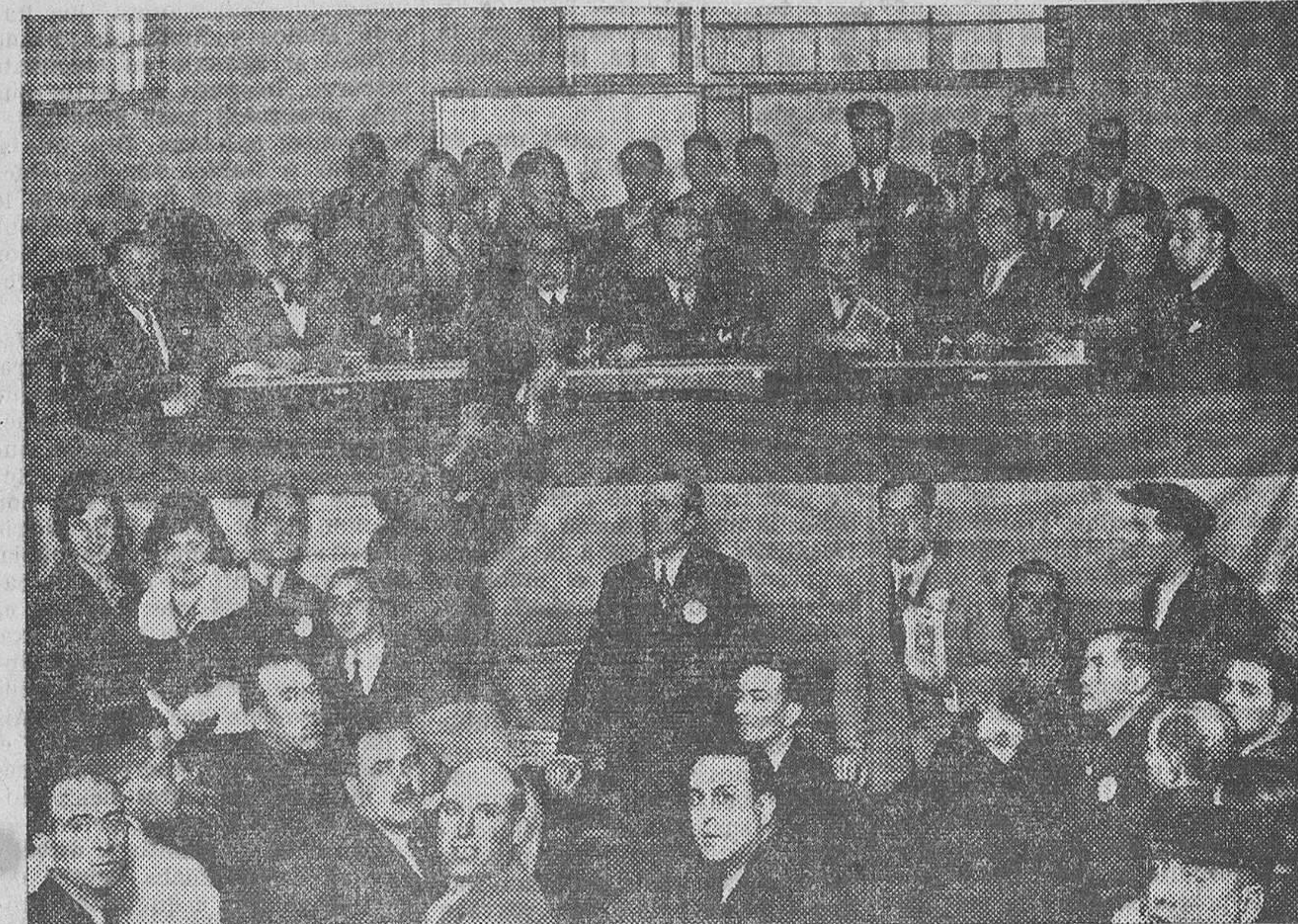
LA MESA PRESIDENCIAL DE LA ASAMBLEA

Mañana publicaremos la Memoria leída por la Secretaría y la relación de asistentes, delegaciones y adhesiones y comenzaremos a publicar las memorias que las distintas ponencias han presentado para el problema agrario.