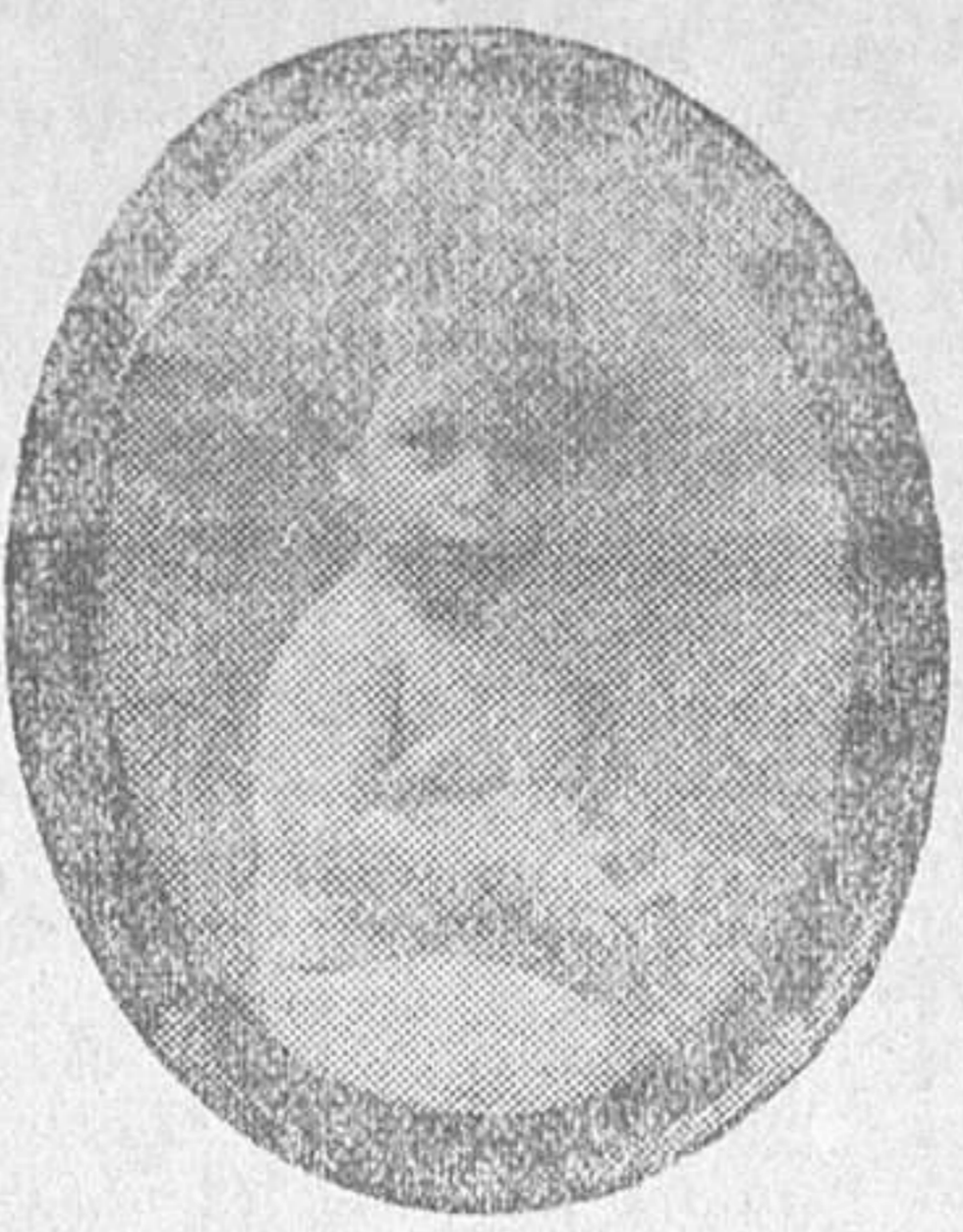
COMO EL FOTOGRAFADO ADJUNTO