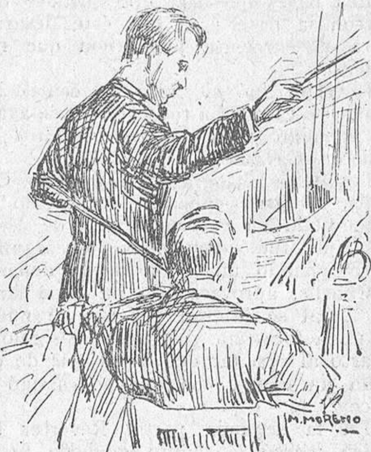
Un momento del concierto

En la primera parte del programa figuraban la abertura de «Ruy Blas», de Mendelssohn, el «Aria en ré, de S. Bach y una selección de «Lohengrin», que se aplaudieron con entusiasmo, pero lo más interesante del concierto estaba integrado por la difícil y hermosa «Suite», de Guiraud, uno de los maestros de la escuela francesa que, como Godard, Bizet, y Chabrier, fué arrebatado prematuramente al arte. La interpretación que dieron los componentes de la Orquesta Valenciana á tales páginas musicales, consi-