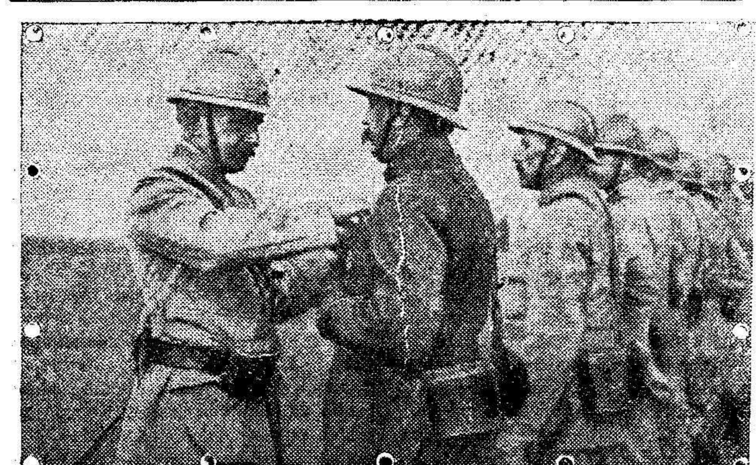
El general Marchand condecorando á algunos defensores de Verdun