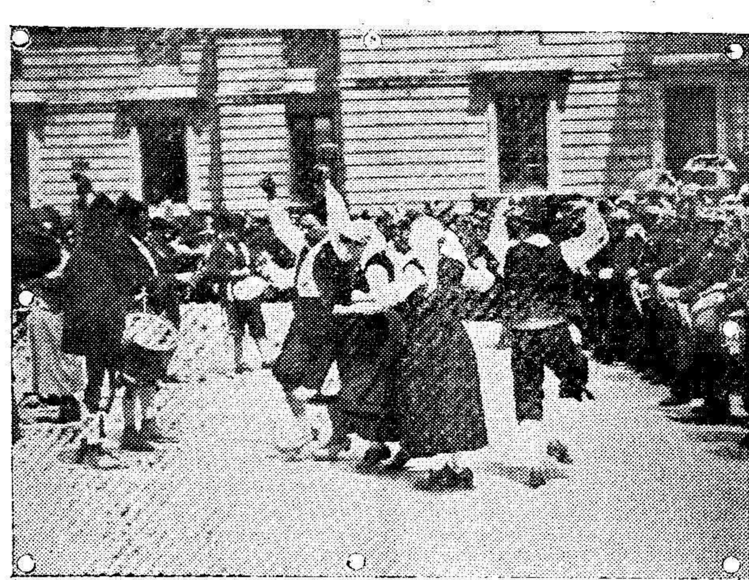
Bailes asturianos verificados en la plaza de Armas del Palacio Real en presencia de los Reyes.

un ama de leche. Razón en esta Administración.