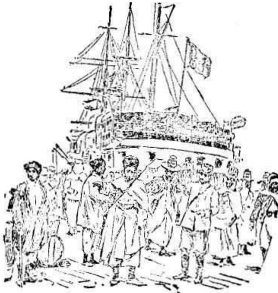
Desembarco de los últimos refuerzos recibidos por el ejército francés en Casablanca

dría ocurrir llegaran á una intoligencia Haffid y el Pretendiente.