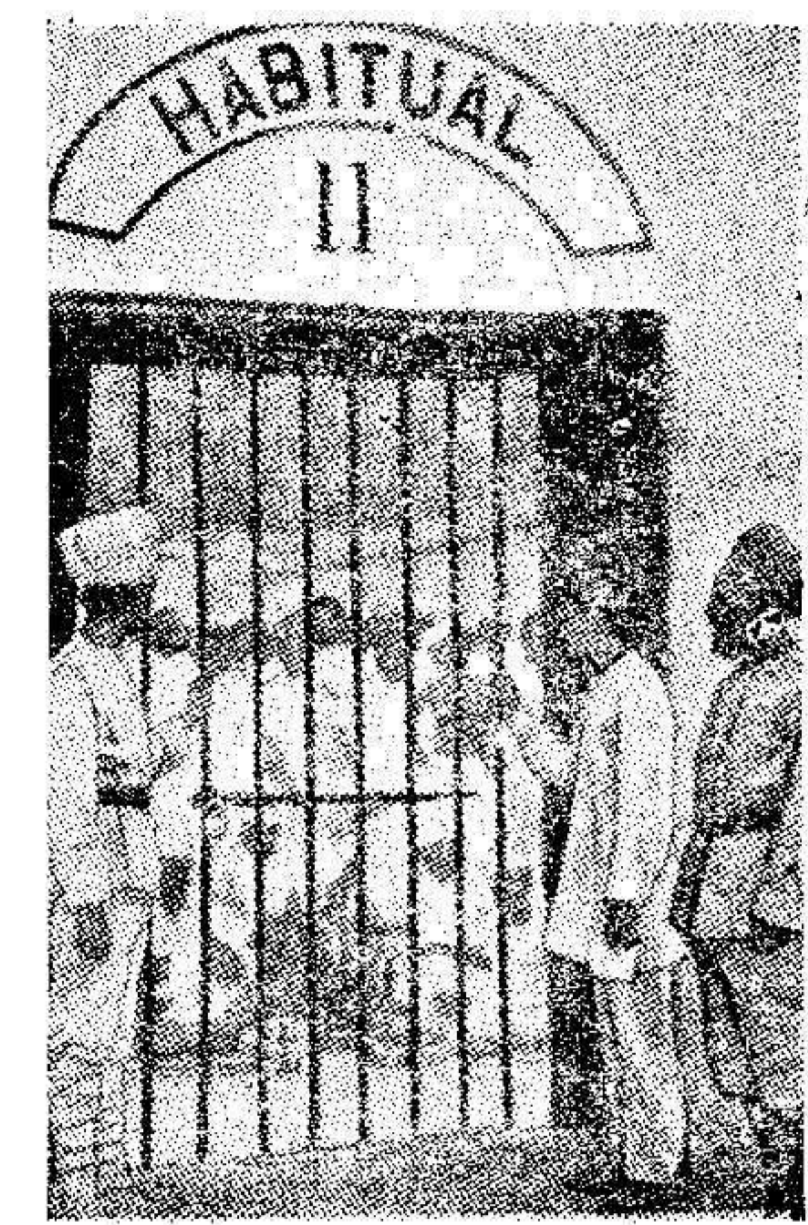
La foto muestra la prisión de Poona en la India, donde Mahatma Gandhi se halla encarcelado. Como se sabe, el líder nacionalista ha comenzado su ayuno hasta la muerte.