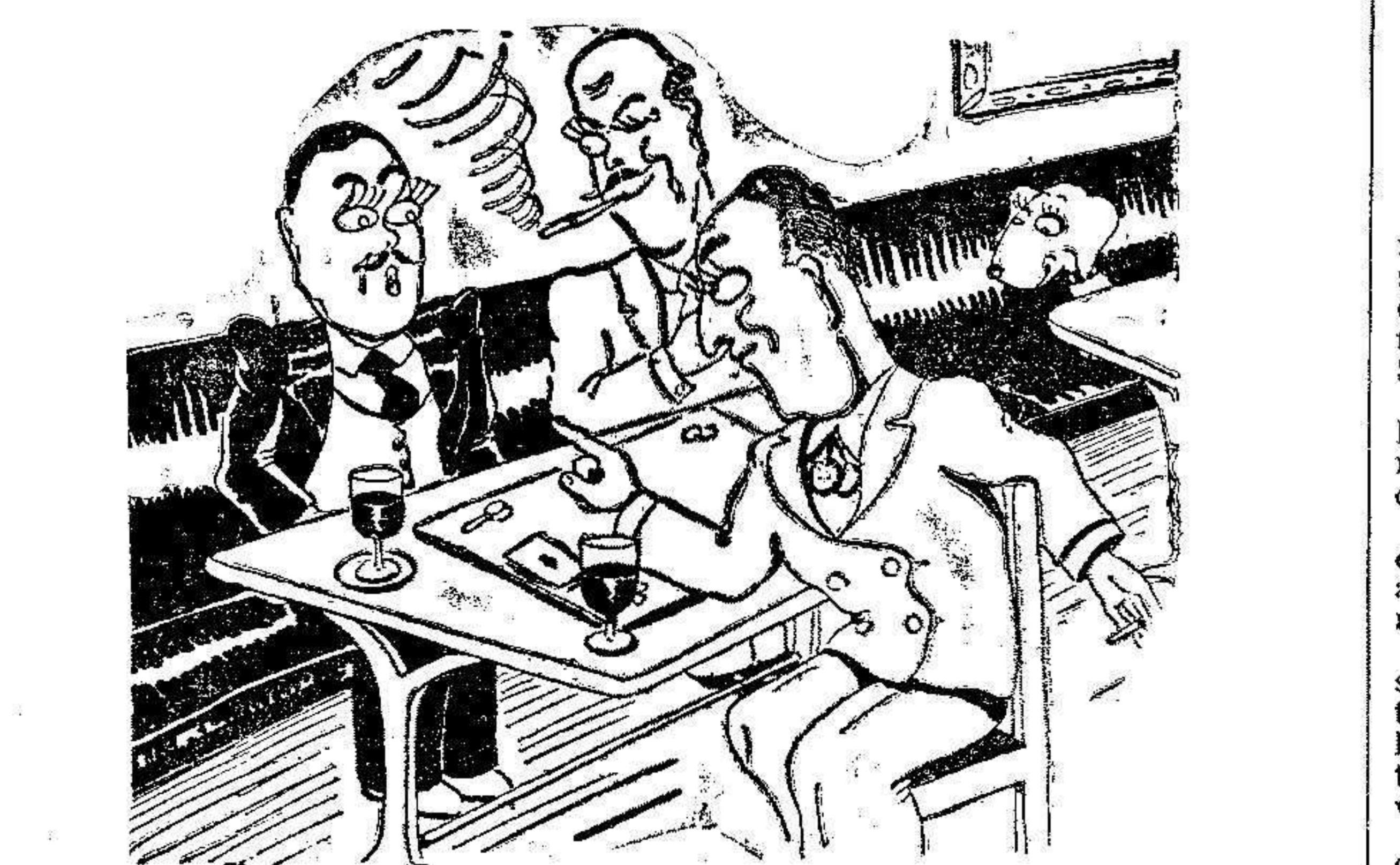
—¿Tú no lo sabías? Un ladrón ha entrado en mi casa, saltando por la ventana del cuarto de la muchacha, que estaba enferma.