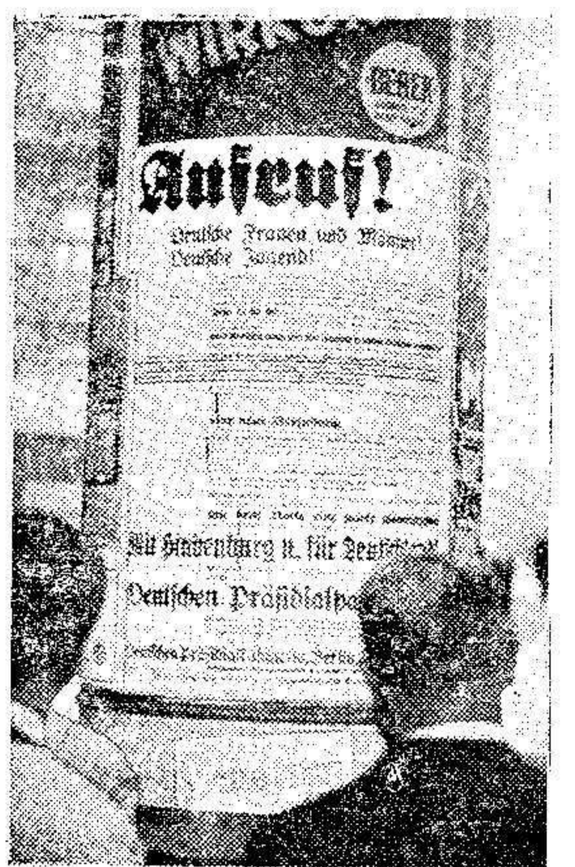
En Alemania se ha constituido un nuevo partido político, denominado «Partido presidario». Nuestra foto muestra a los berlinenses, estudiando la proclamación del nuevo partido.