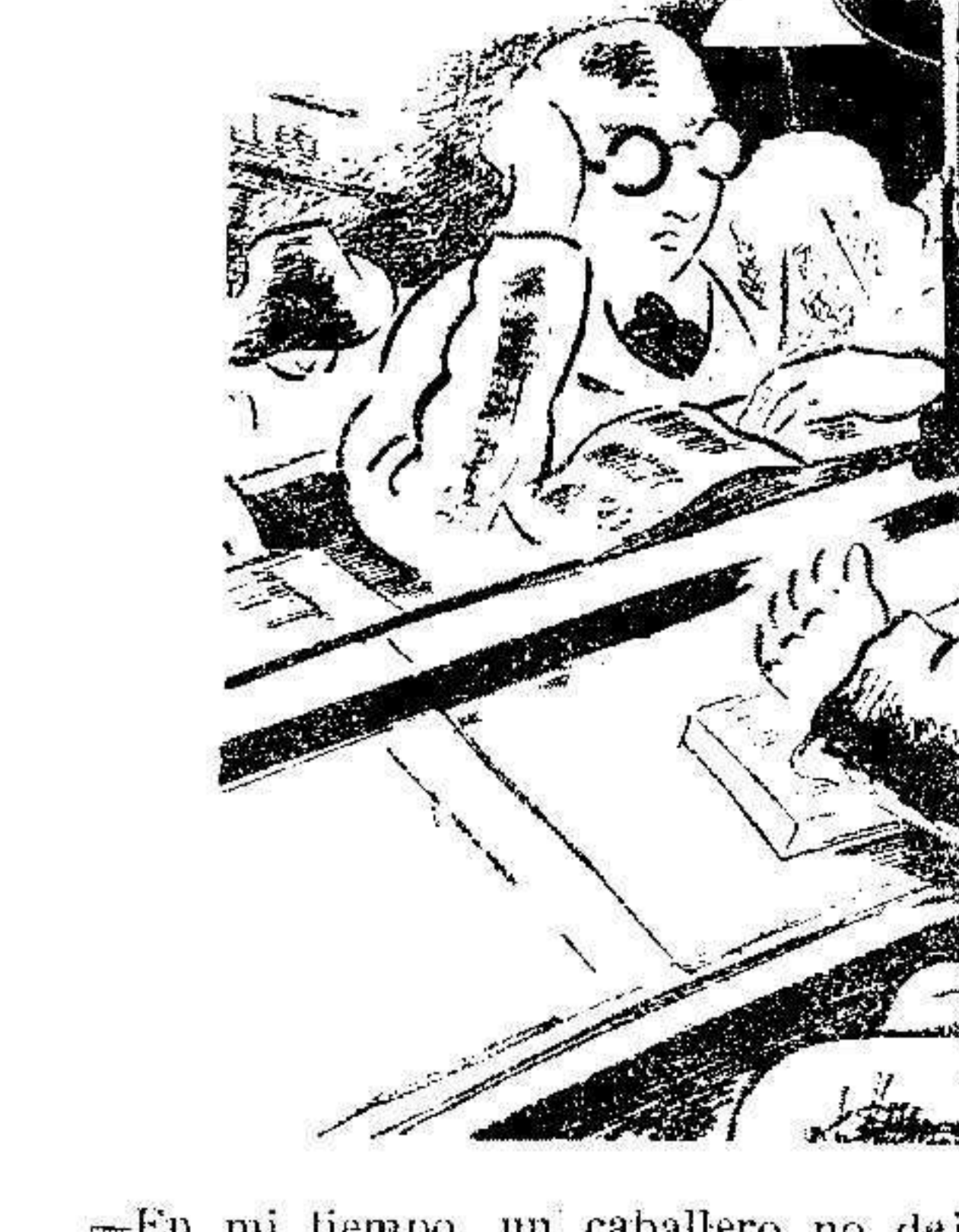
—En mi tiempo, un caballero no dejaba a una dama de pie en el tranvía. —¡Claro! Como que en su tiempo no había tranvía.