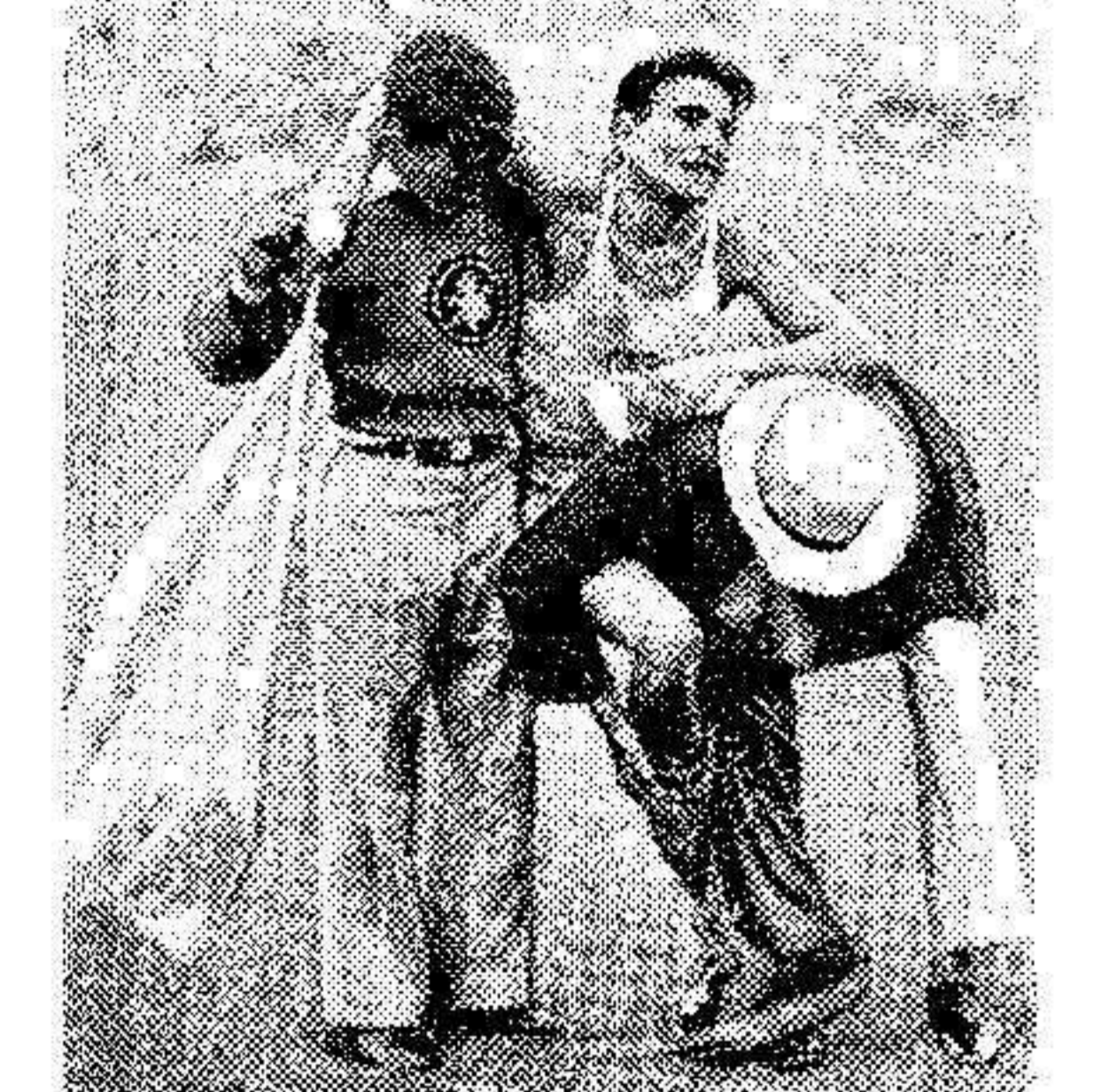
Juan Zabala, el corredor argentino que ha ganado la carrera Marathon en los juegos olímpicos. La foto lo muestra sostenido por sus dos compañeros al terminar el recorrido de 12 kilómetros.

(DE NUESTRO CORRESPONSAL ESPECIAL) MUSULMAN CONDECORADO