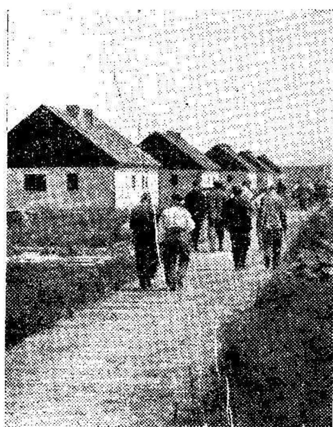
Existen en las afueras de Berlín, casas habitaciones para ocho mil personas. La foto muestra un grupo de casas recientemente edificadas para los parados.