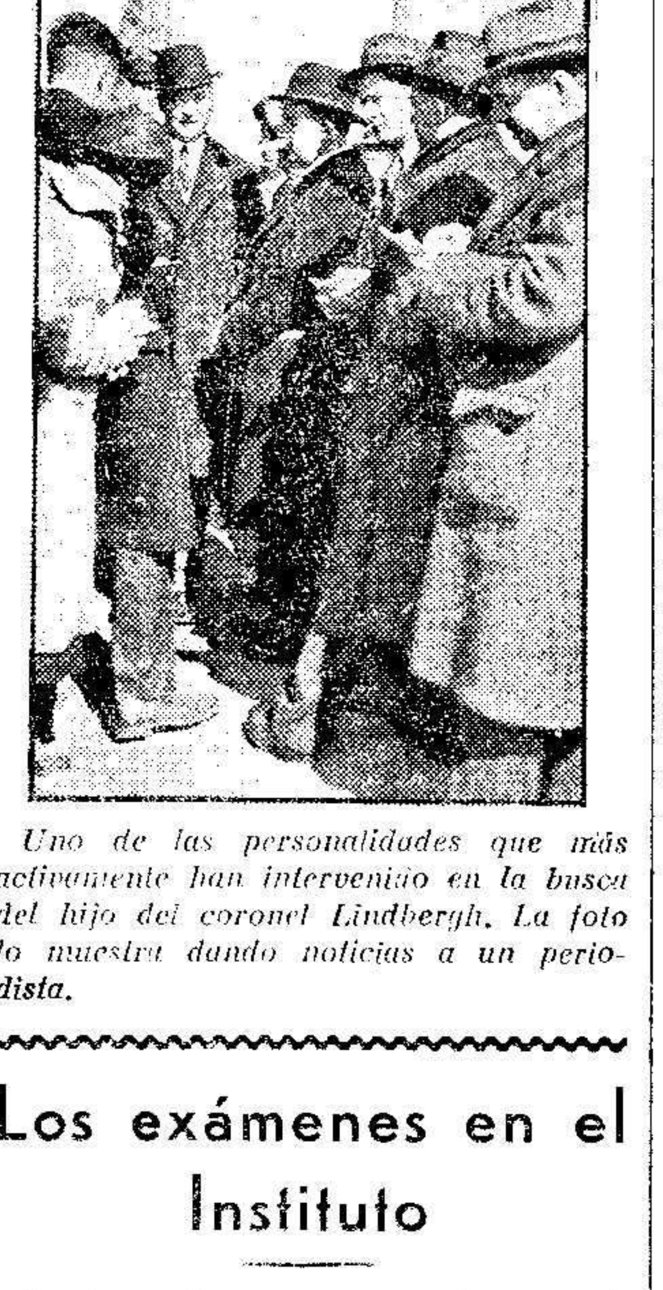
Uno de las personalidades que más activamente han intervenido en la busca del hijo del coronel Lindbergh. La foto lo muestra dando noticias a un periodista.