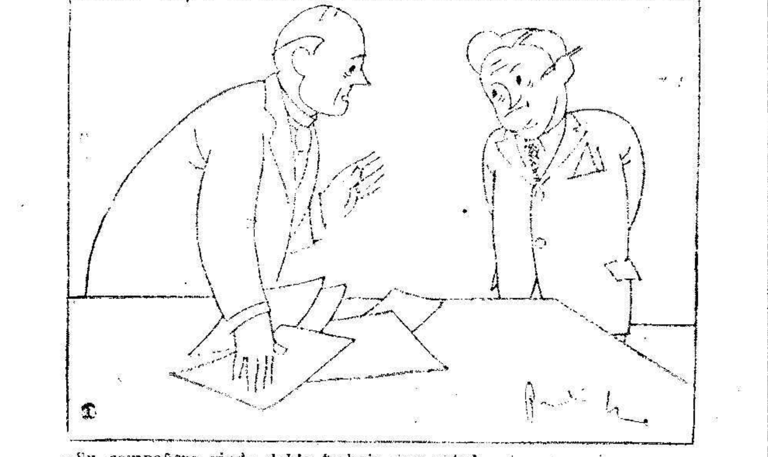
-Su compañero rinde doble trabajo que usted. -Ya se lo digo yo, pero no quiere hacer caso.

Los diputados de las Constituyentes que hasta ahora han presentado sus actas, se clasifican así por profesiones. Abogados, 129; Médicos, 41; Catedráticos, 50; Maestros y otros profesores, 13; Periodistas, 30; Arquitectos, 3; Ingenieros, 8; Sacerdotes, 8; Publicistas, 15; Notarios, 4; Registradores de la Propiedad, 2; Militares, 8; Marineros, 2.