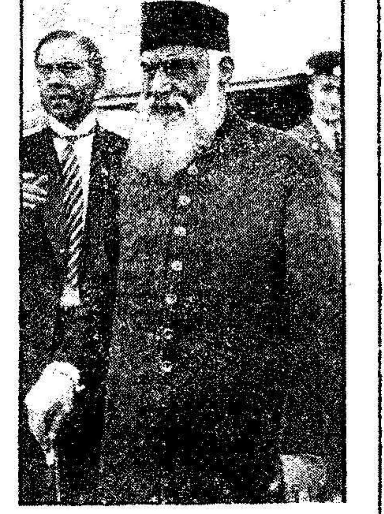
M. Paetai, presidente de la Asamblea Nacional de la India que, con M. Ghandi serán los representantes de la India en la Conferencia de la Tabla Redonda en Londres.