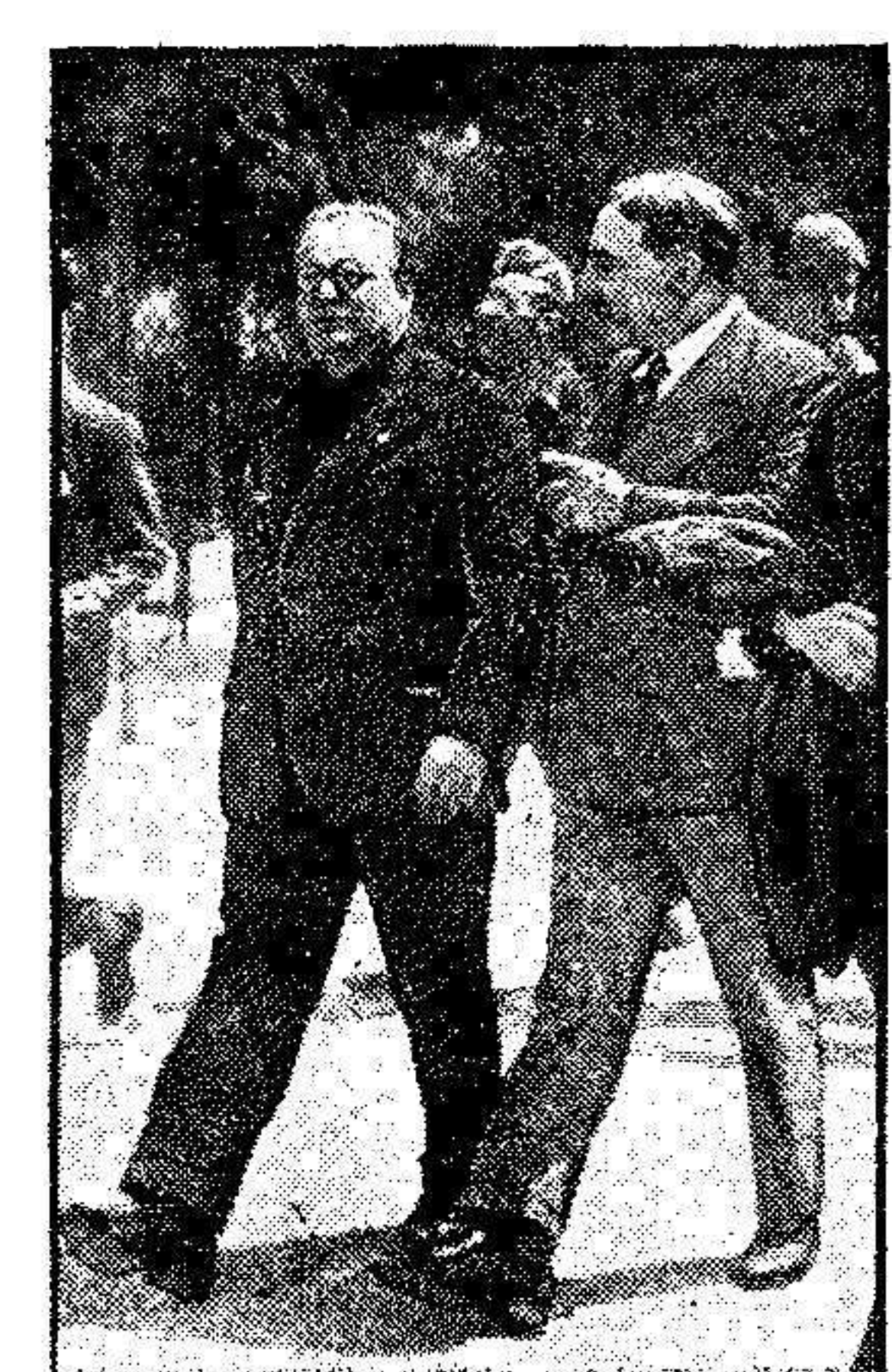
El hermano del Duce, director de un periódico fascista, y a quien se le señala como instigador de los artículos que hunden a la tirantez de relaciones entre el fascio y el Papado.