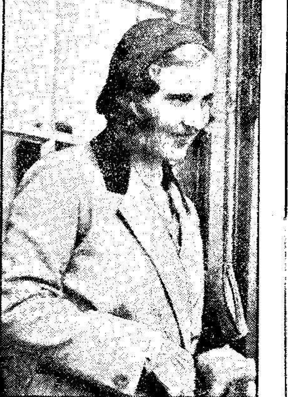
La Princesa Ingrid, hija de un Príncipe Real de Suecia, visita actualmente Inglaterra. En su hogar, en el palacio de Buckingham se ha dado un baile de gala, y ello ha dado lugar a que en los círculos aristocráticos se hable de una próxima casamiento entre la citada Princesa y el Príncipe Jorge de Inglaterra.