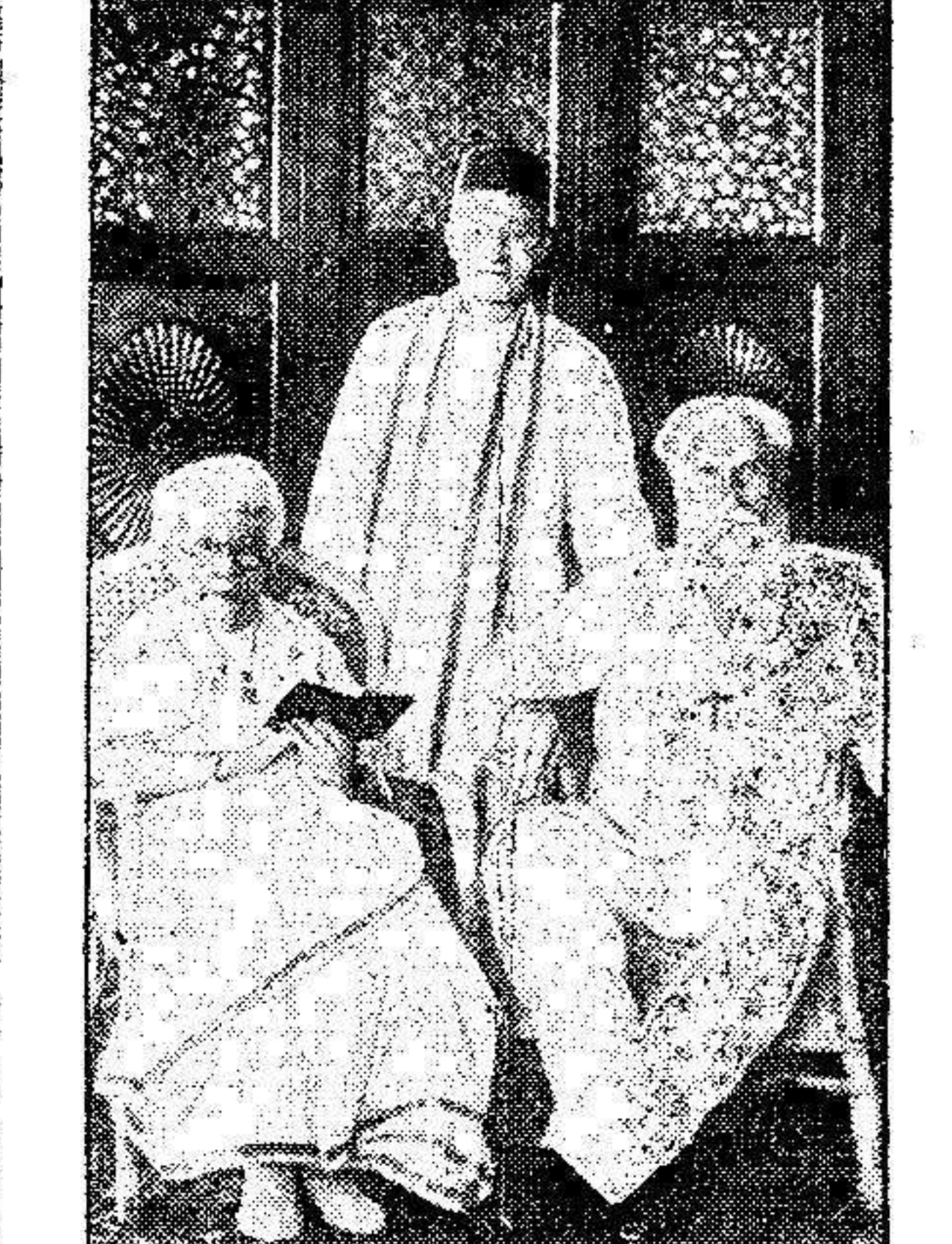
El conocido líder teosófico, que en su tiempo atrajo la atención del mundo, en unión de dos miembros prominentes del Círculo Teosófico.