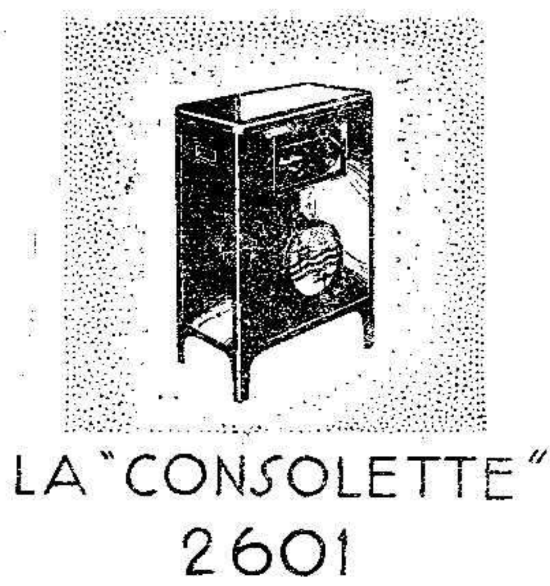
LA "CONSOLETTA" 2601

PHILIPS IBERICA Paseo de las Delicias, 71