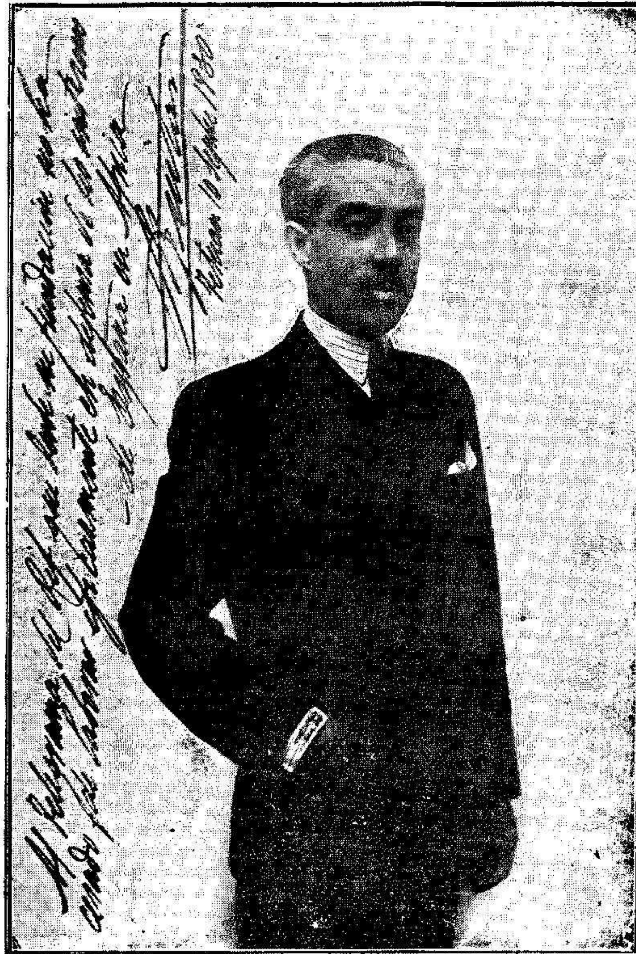
Excmo. Sr. Don Teodomiro de Aguilar, Delegado General de la Alta Comisaría de España en Marruecos, y Alto Comisario interino.

Exigen las siguientes operaciones: 1.ª — Elección de la línea en cuyos extremos se ha de estacionar la máquina fotográfica, línea llamada base. 2.ª — Fijación de uno de los extremos de la base con relación a vértices topográficos, ya situados. Esta operación se efectúa con el teodolito. 3.ª — Medición de la base que se realiza con el teodolito y la mira. 4.ª — Obtención de las fotografías. El procedimiento exige que la máquina fotográfica se coloque en sus dos posiciones con los ejes ópticos completamente horizontales y paralelos entre sí, y que las placas estén colocadas en el mismo plano vertical normal a dichos ejes, a cuyo fin la máquina está construída con todos los elementos necesarios para conseguirlo. En cada extremo de la base se obtienen tres fotografías; la normal, la oblicua derecha (declinada 35 grados a la derecha) y la oblicua izquierda (declinada 35 grados a la izquierda). Estas tres fotografías proporcionan los datos necesarios para levantar el plano del terreno comprendido en un frente de 120 grados, con una profundidad determinada por la longitud de la base. El equipo de campo empleado por esta Comisión ha sido el foto-teodolito Zeiss, modelos años 1916 y 1923, con placas 13 por 18.