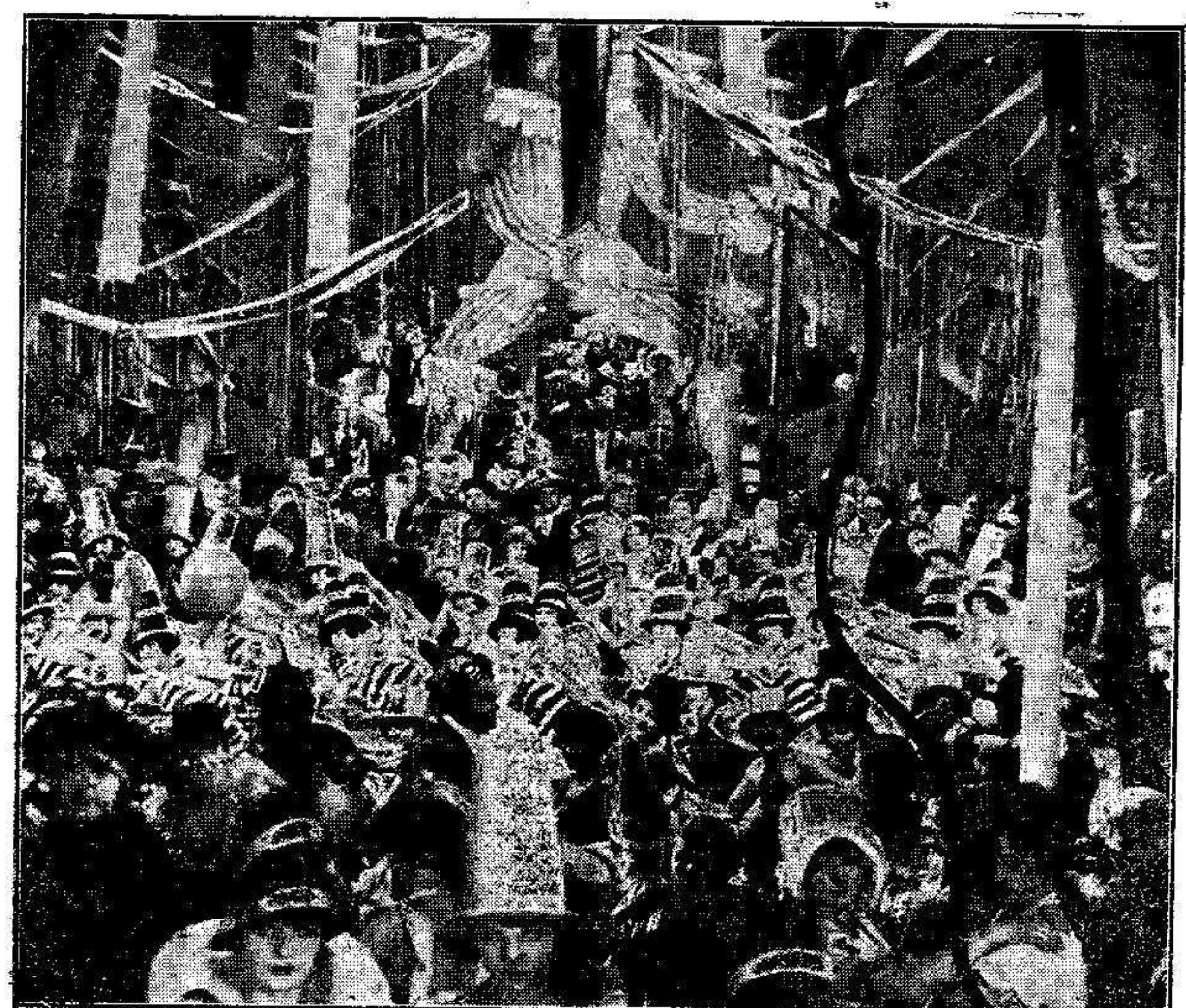
El baile ardía en serpentinas en aquel momento, y se derrochaba alegría y buen humor

de lejos, le pudo ver en un saloncito que estaba casi siempre desierto. Pero no estaba solo. «¿Con quién está?» El Jocker aguzó la vista, se caló las gafas y pudo ver que se hallaba en compañía de Lady Cécel y de su hermana Gill, por la que sentía una secreta simpatía. Como nadie le había invitado ni autorizado para asistir a aquella entrevista (baste a retírarse, cuando creyó advertir que la conversación se llevaba con un nerviosismo desacomodado. Lleno de interés decidió observar desde su sitio, desde el que no se podía distinguir lo que hablaban las tres personas, y vio que Lady Cécel, después de largas vacilaciones, entregaba a Dorlino su collar de perlas y que Dorlino, a su vez, entregaba a Lady Cécel, un paquete de papeles. Luego vio que Dorlino, guardándose el collar sacaba un objeto del bolsillo y que se lo enseñaba a la noble dama, pronunciando unas palabras que parecieron llevar la desesperación al ánimo de ambas señoras.