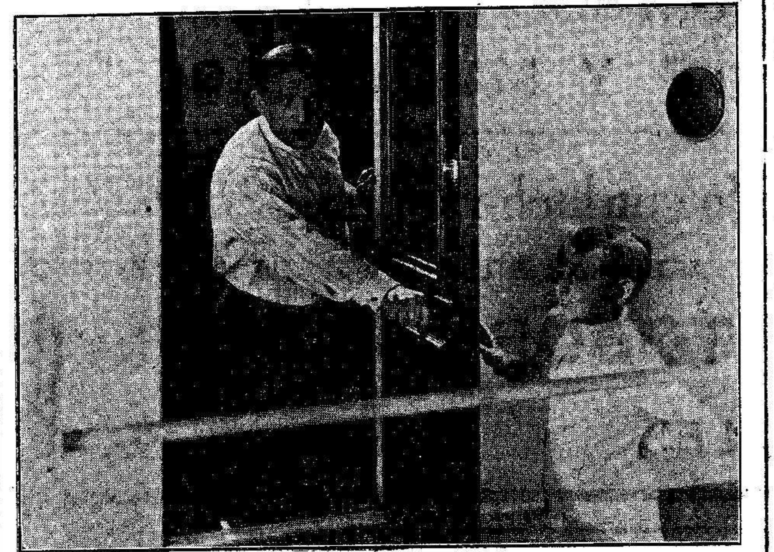
Un niño vino a interrumpir la monótona existencia del misterioso viajero, cuando éste se disponía a recluirse en su camarote.

amigos. La amistad de un niño, es un gran derivativo para las grandes preocupaciones. Pero, el desconocido, se limitó a hacer esa amistad durante la travesía, cruzando con el resto de las personas un saludo frío, que a veces, parecía tímido. Solo durante la mayor parte del día, salía para vez de su mutismo, de manera que, a la irregularidad de su embarque, hubo pronto que añadir el misterio de su conducta. No hacía falta más, para intrigar hasta el último grumete e incluso al capitán, hombre poco aficionado a hacer observaciones psicológicas sobre las personas, y acostumbrado a contentarse con estudiar la cara del cielo y del mar. Los marineros lo tomaban como tema de conversación, y el segundo de a bordo ardía en deseos de hablar con él. En vista de que sus esfuerzos eran inútiles, apeló al cura.