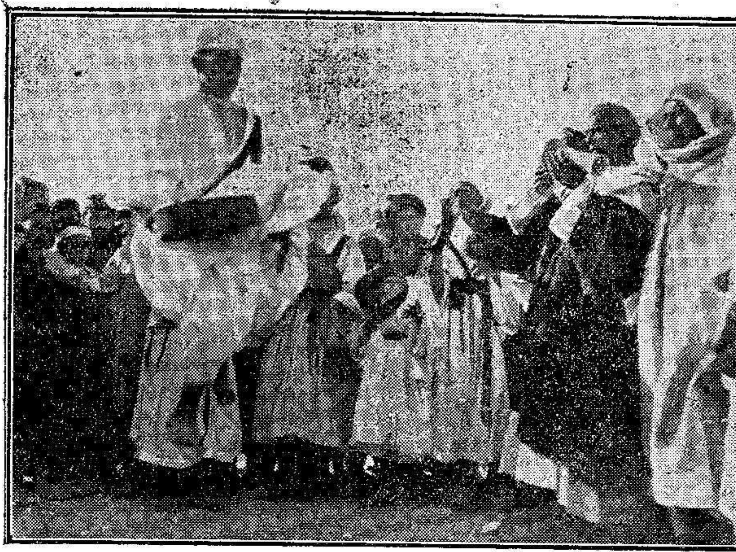
Los típicos músicos y bailarines morunos que amenizan los zocos.

Se trata de una lección de política indígena, que no debemos olvidar, como muchas más que nos ofrece la actuación de los italianos en Cirenaica y Tripolitania.