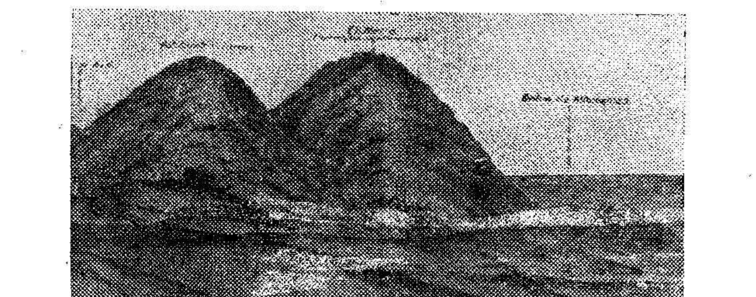
Hemos publicado una vista de Morro Viejo y montes vecinos, tomada desde la bahía de Alhucemas, a cierta distancia de la costa. Aquel Cabo que en el horizonte se destaca con escaso relieve, lo dibujó desde la casa de Abd-el-Krim el bravo teniente D. Luis Casado, durante su estajerío, y de esa perspectiva ofrecemos al lector una copia.