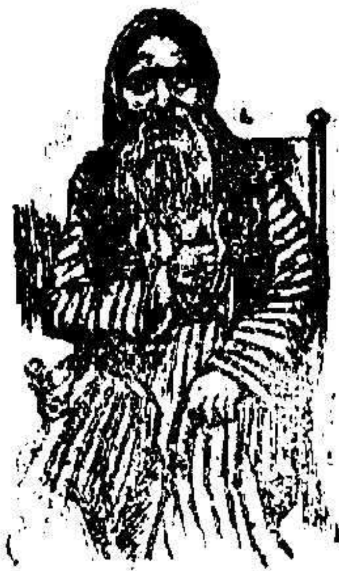
El Gran Rabino de Fez