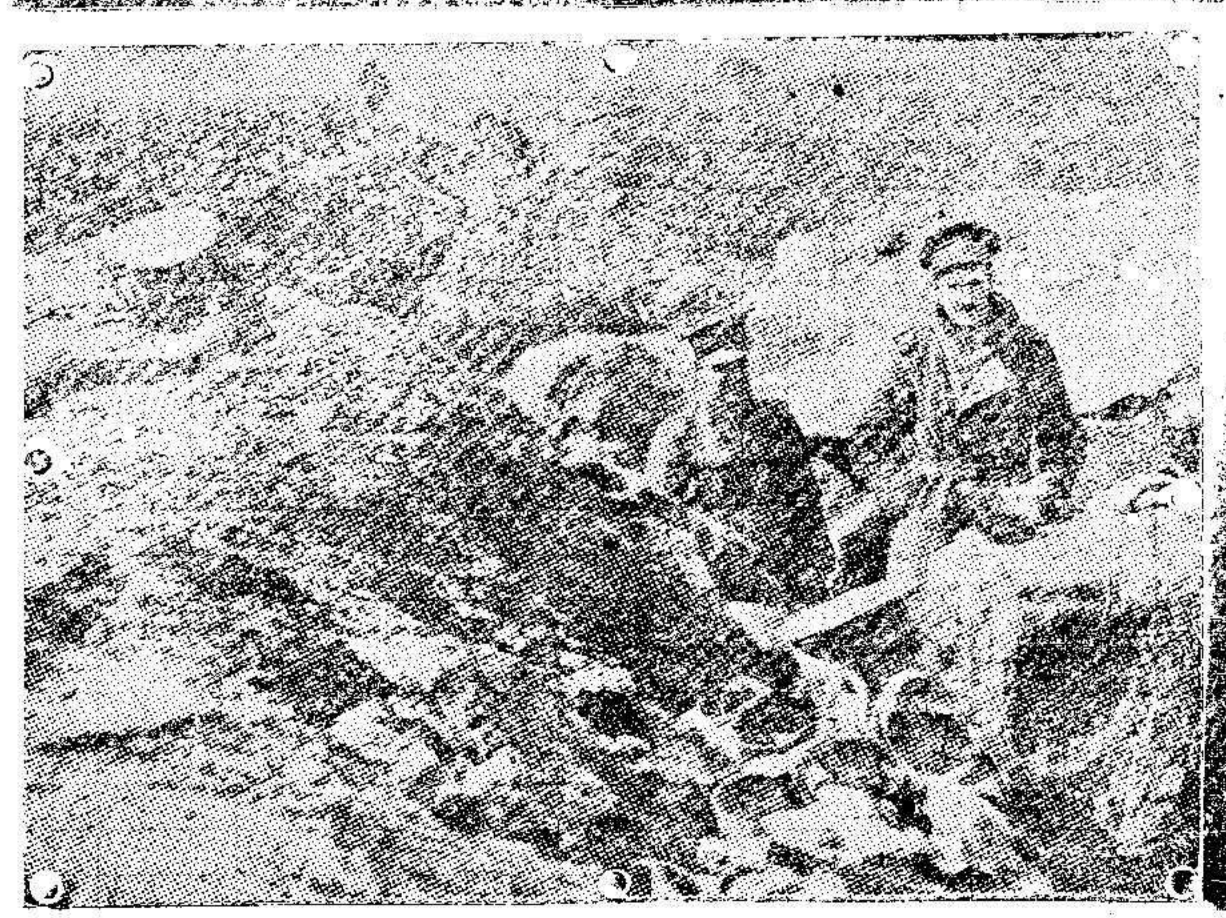
Las trincheras inglesas en la batalla del Iser.

No voyais á creerme—dijo—que los alemanes seamos tan idiotas para comprometer á los zeppelins enviándolos sobre Londres. Conservamos todos nuestros dirigibles para un ataque simultáneo de la costa inglesa por nuestros barcos y nuestros zeppelins. Enviaremos una docena de zeppelins á la vez y contamos que perderemos acaso la mitad, pero el resto hará lo suyo seguramente. En todo caso, no se trata de un plan practicable con el mal tiempo que tenemos actualmente en el mar del Norte. Esperamos á la primavera.»