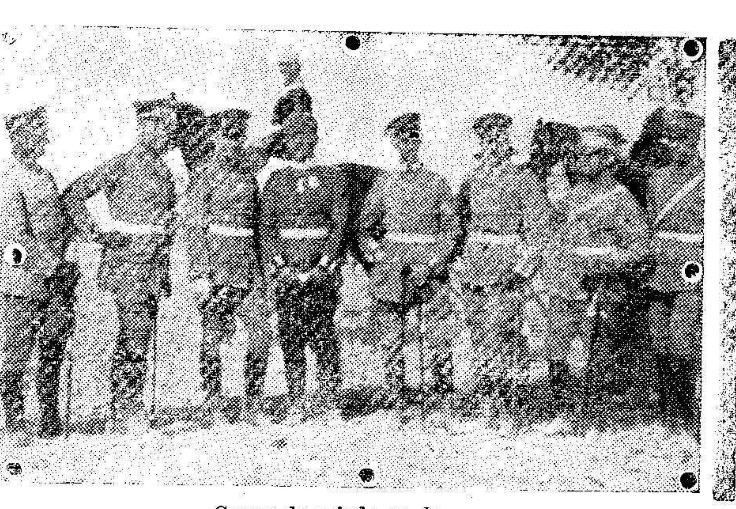
Grupo de aviadores alemanes.

Es la única casa que con perfección transcribe el color de los UNIFORMES DE LA LANA Y ALGODON del KAKI ANTIGUO al nuevo y reglamentado color KAKI VERDE. La intensidad de UNIFORMES teñidos al nuevo color demuestran una vez más la perfección y solidez con que trabaja esta acreditada TINTORERIA.