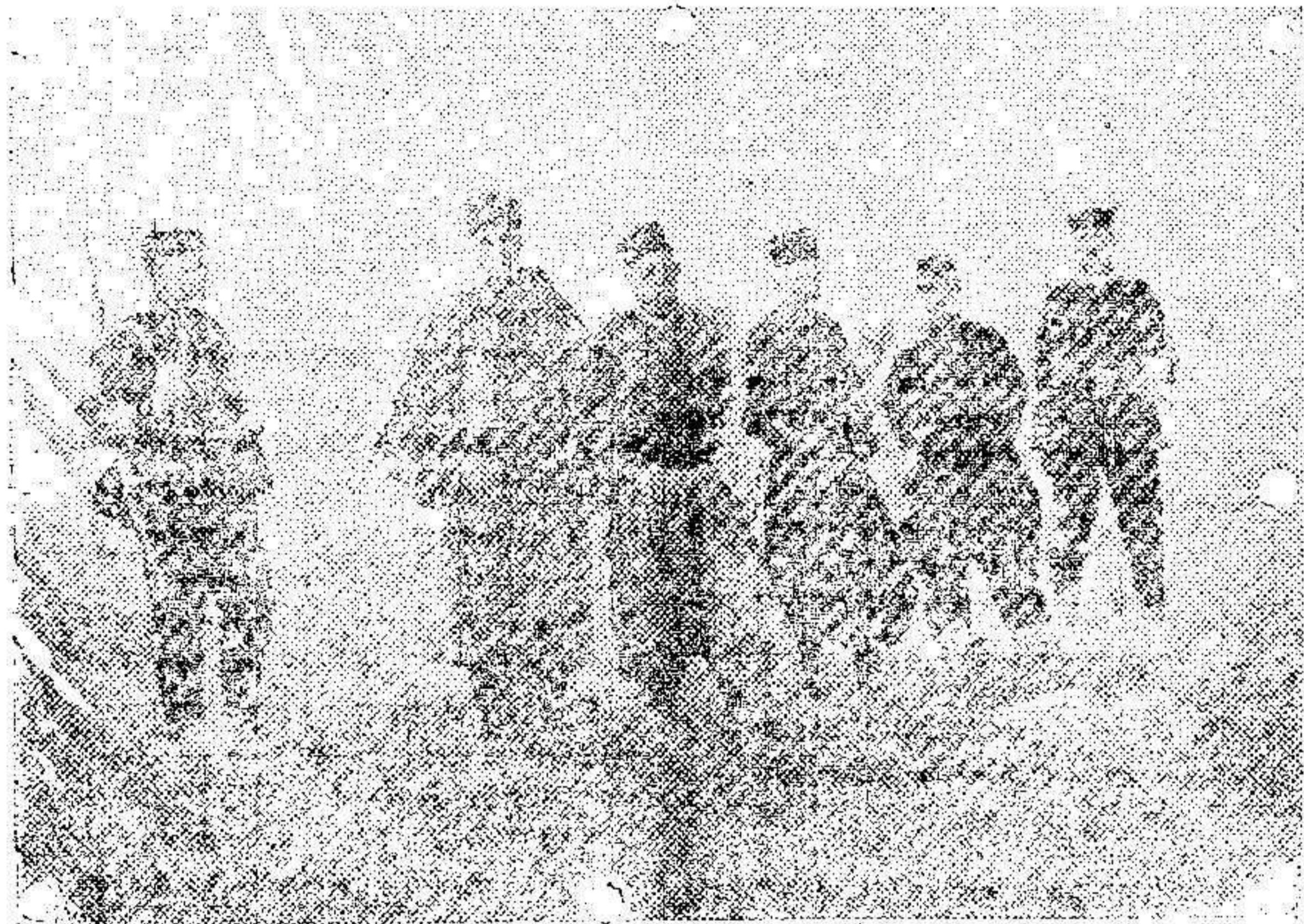
Soldados argelinos prisioneros en poder de los alemanes.

Franqueo concertado.—No se devuelven los originales. NUM. 9.116