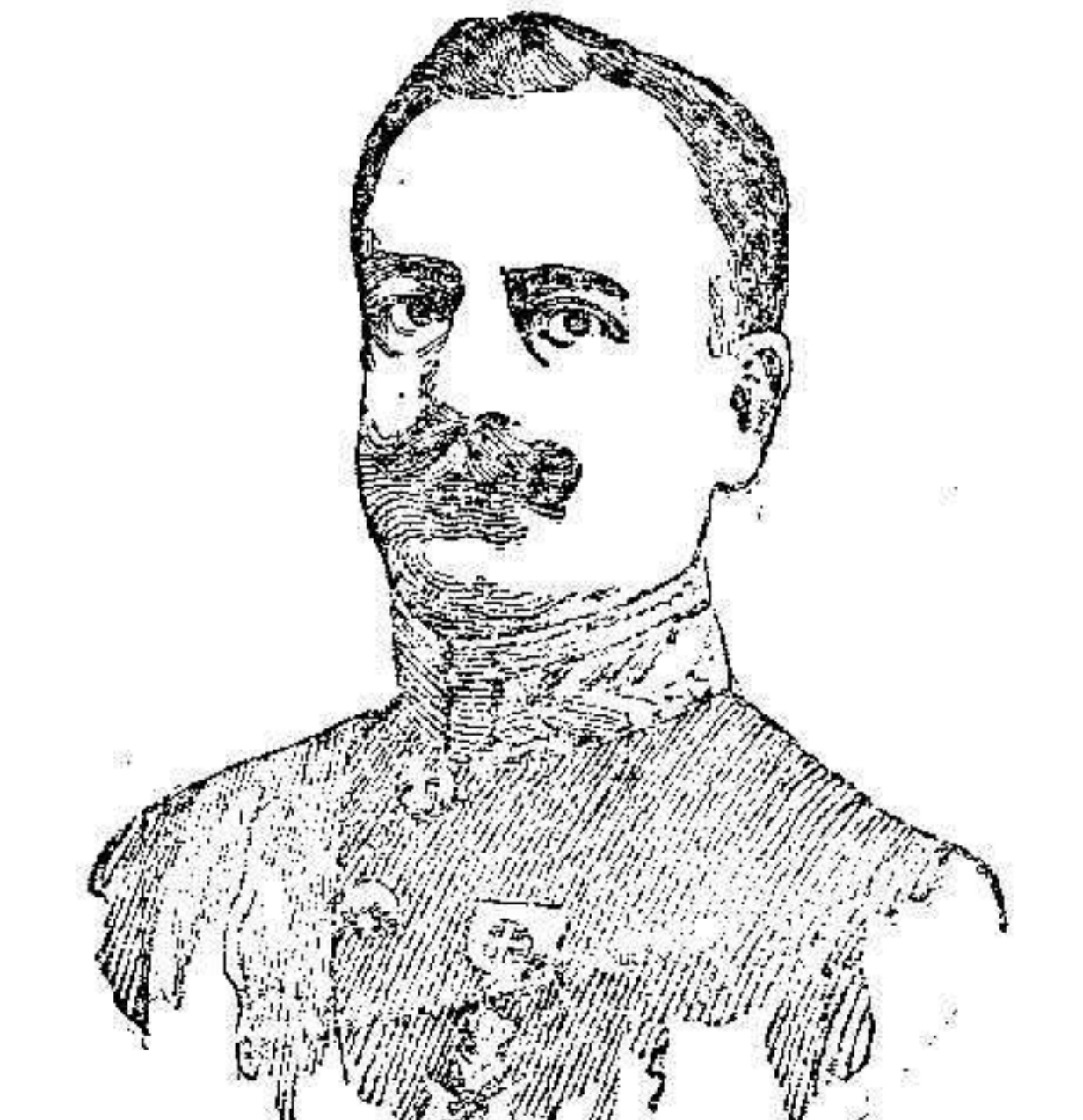
Mr. de Broqueville, ministro de la Guerra de Bélgica